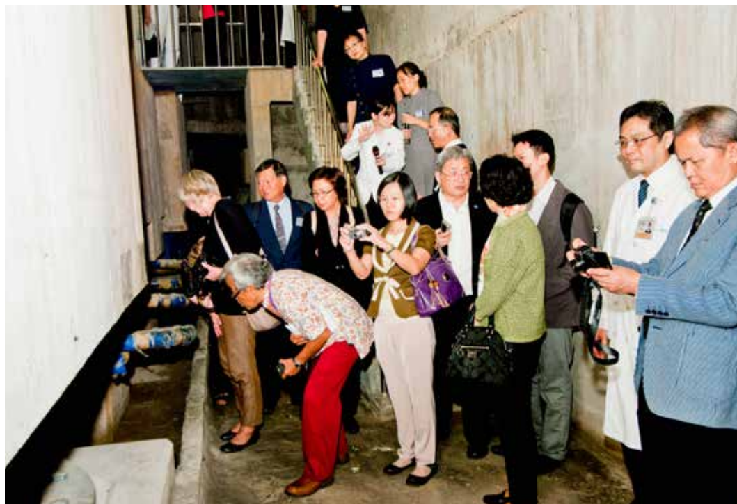
外賓實地參觀臺北慈濟醫院的地下室回收雨水管道間，了解慈濟醫院的硬體規劃完全以環保節能考量。