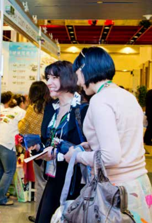
HPH 兩位來自義大利的來賓響應素食，獲得大愛感恩科技的環保圍巾小禮物，開心的與慈濟醫療志業素食的導覽志工交換心得。