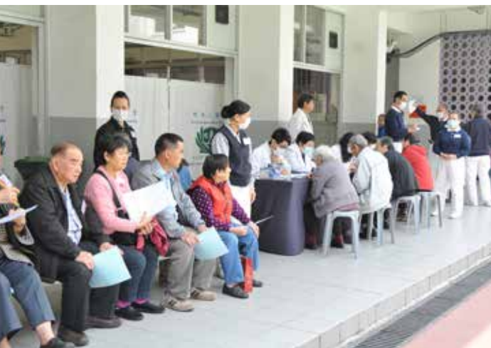
■ 這場在九龍工業學校所舉辦的義檢活動，一共嘉惠了一百六十一人。