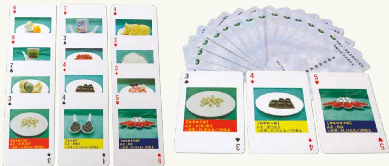
■ 由花蓮慈院腎臟內科團隊研發的高磷撲克牌，將平常各種食物的含磷量簡單明瞭的標示在撲克牌上，效果非常好，更獲得腎友認同。

為此，我和王智賢醫師以及游純慧、張逸真、黃月玲、梁鳳琴四位護理師，一同設計開發出一套專為病人設計的「高磷撲克牌」，我們分工合作，有人去買菜；有人負責照相並計算食物的磷含量；還有同仁利用這套設計去和病人做衛教。經過半年測試並統計病人們血中磷和鈣的變化，發現狀況都有改善，證明我們的做法真的有用。所以在二〇一一年五月我們就報名參加國家新創獎並得獎，雖然這不是甚麼高科技的創新，但是「小兵立大功」，是軟體的實力，也是醫療人文的創新。