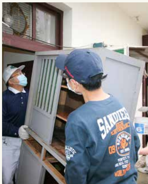
■ 方醫師帶著孩子一起參加慈濟感恩戶打掃，和兒子合力將櫃子搬回屋內。