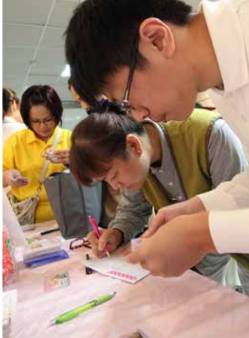
慈院同仁、志工及民衆用實際行動響應器官捐贈。

吳先生的母親罹患 C 型肝炎惡化造成肝硬化，急需換肝，卻苦等不到有人捐肝，剛退伍的他在五個月內減重十五公斤，只為將身體調整最佳狀態，希望能捐給母親一個健