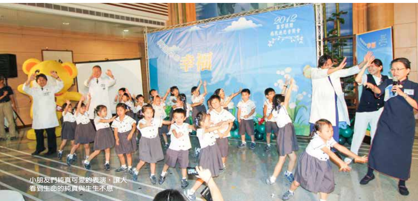
小朋友們純真可愛的表演，讓人看到生命的純真與生生不息。

目前器官移植的技術，器官捐贈者能夠選擇捐出心臟、肺臟、肝臟、腎臟、胰臟、眼角膜、皮膚、骨骼，可同時幫助十多位病人。根據器官捐贈移植登錄中心統計，從今年初至十月二十七日，臺灣已有四百六十八位病人接受器官移植，但還有八千零五十二位病患在等待移植。