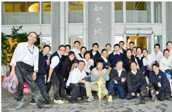
勞動過後完成任務，雖然雨水混著汗水和泥濘，人人卻開心而充實。攝影 / 廖育賢

清掃接近尾聲，太陽悄悄地從雲隙中探出頭，形成一道美麗的彩虹，在參與活動的同仁心底留下難忘回憶。🌈