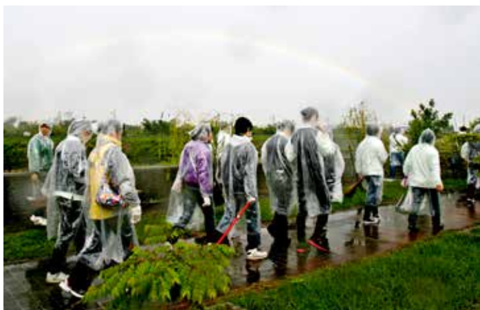
清掃完畢，雨後的彩虹，參與的同仁心底留下了美好的回憶。攝影 / 呂榮浩