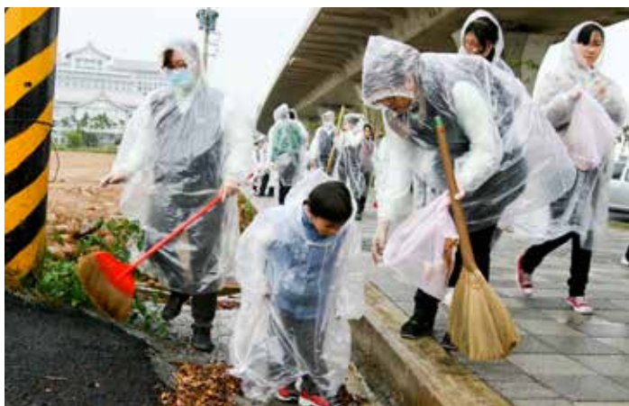
雖然下雨，攜家帶眷在自行車道旁撿拾垃圾，心很充實。