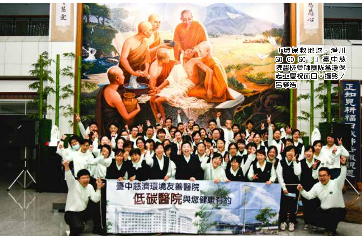
「環保救地球，淨川GO GO GO！」臺中慈院醫檢藥師團隊當環保志正慶祝節日。

大雨並沒有澆熄同仁的熱情。藥劑師、檢驗師平常待在醫院裡調劑藥品、抽血做檢驗，許多人是第一次穿著雨衣，拿起夾子、掃把和垃圾袋等清掃