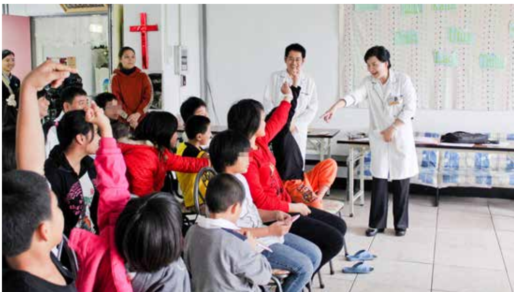
有獎問答的宣導正確用藥觀念，小朋友們踴躍舉手搶答。