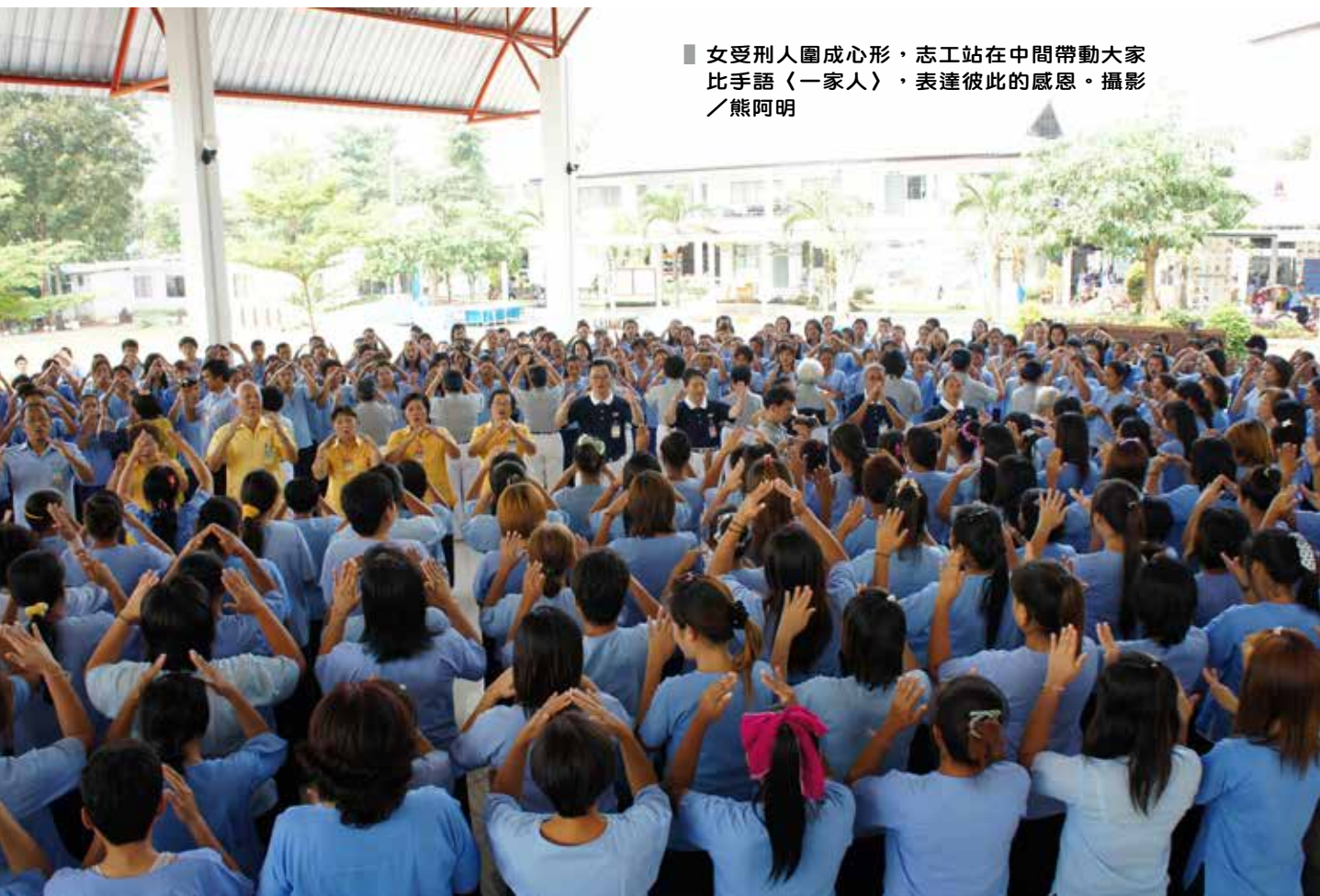
■ 女受刑人圍成心形，志工站在中間帶動大家比手語〈一家人〉，表達彼此的感恩。

用完午齋後，女受刑人再次集合、圍成心形，所有志工站在中間，大家共同以手語〈一家人〉表達彼此的感恩。離開之前，慈濟志工將親手做的玫瑰一一送給她們，表示鼓勵與祝福。