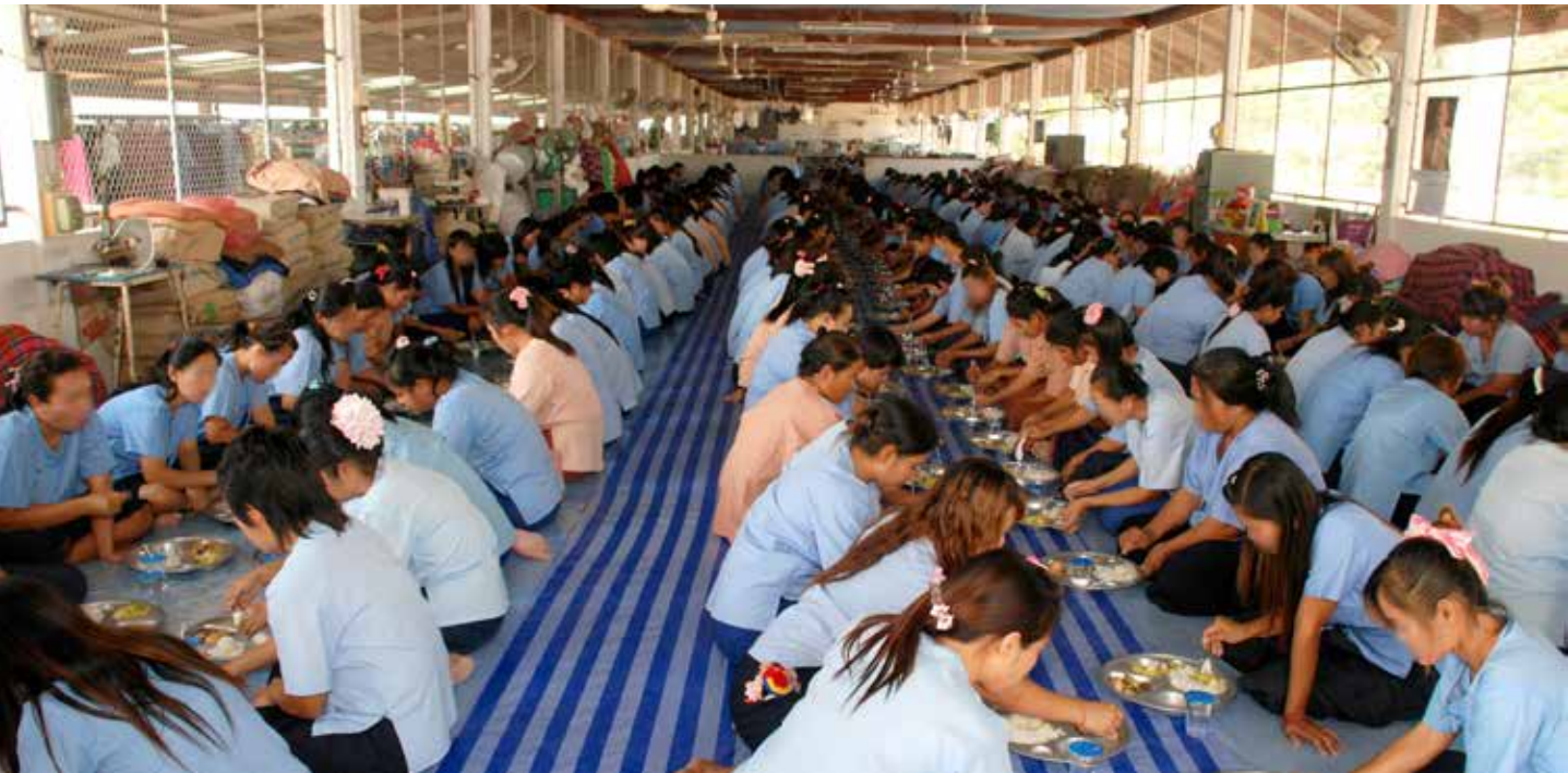
■ 叻丕府女子監獄的受刑人，開心的享用由慈濟志工與人醫會成員共同為她們準備的午齋。攝影／桑瑞蓮

關懷受刑人的這個方法，是給予受刑人很大的精神鼓勵。從我擔任監獄管理工作以來，這是我第一次看到這樣的活動，有很多單位集合力量、體貼的跟受刑人互動，很關心她們。」