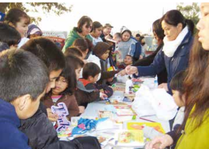
二〇一一年一月，佛瑞斯諾志工在葡萄鎮的發放項目中增加了二手玩具，讓農工家庭的小朋友非常開心。

孩媽媽的兩隻腳大拇趾已有嚴重的指甲倒長問題，非常疼痛，但不敢出來。慈濟人先為孩子看病與剪髮，孩子回去告訴大人，媽媽才來求診。慈濟醫師幫她開刀解決痛源，後來又持續追蹤。漸漸地，農工們相信慈濟人是真心幫助他們，反而會主動告知接下來要移去哪個地方。慈濟人便開始與這裡的社區聯繫，洽談義診事宜。