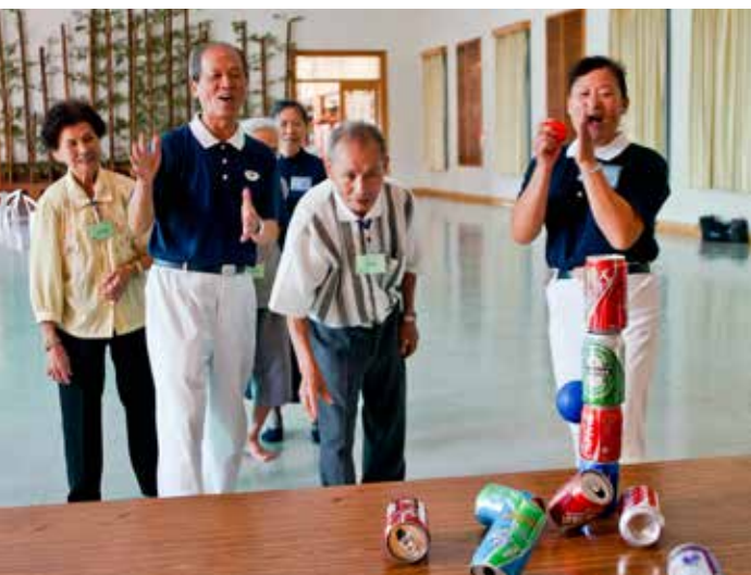
■ 病友在志工的引導下，開心進行各項遊戲。

洪宏典醫師表示，失智症患者最好的治療方法就是「家屬」，因為失智與一般疾病不同，每一個個案都有自己的特性，因此要如何治療，需要家屬的用心，而透過這個活動讓大家彼此分享照顧經驗，互相學習，非常有幫助。