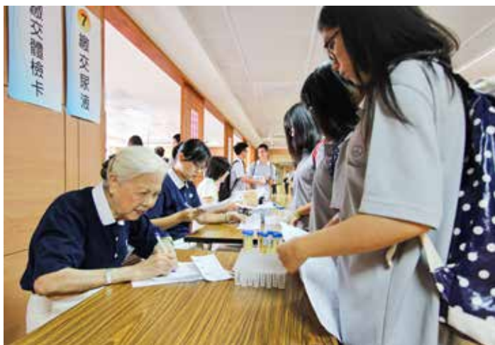
■ 同學口中親切的「志工奶奶」幫大家登記受檢資料。