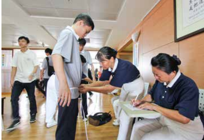
■ 志工親切地為學生測量腰圍。

至今花蓮慈院已經完成慈濟中學、慈濟大學的新生健檢，陸續也將替慈濟技術學院、慈大附中小學部、附設幼稚園的學生健檢。身為花東地區唯一的醫學中心，花蓮慈院也將從九月二十三號開始，承擔起全花蓮國、中小學童的健