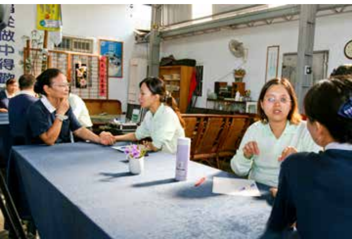
■ 中醫部醫師為環保志工把脈與健康諮詢。