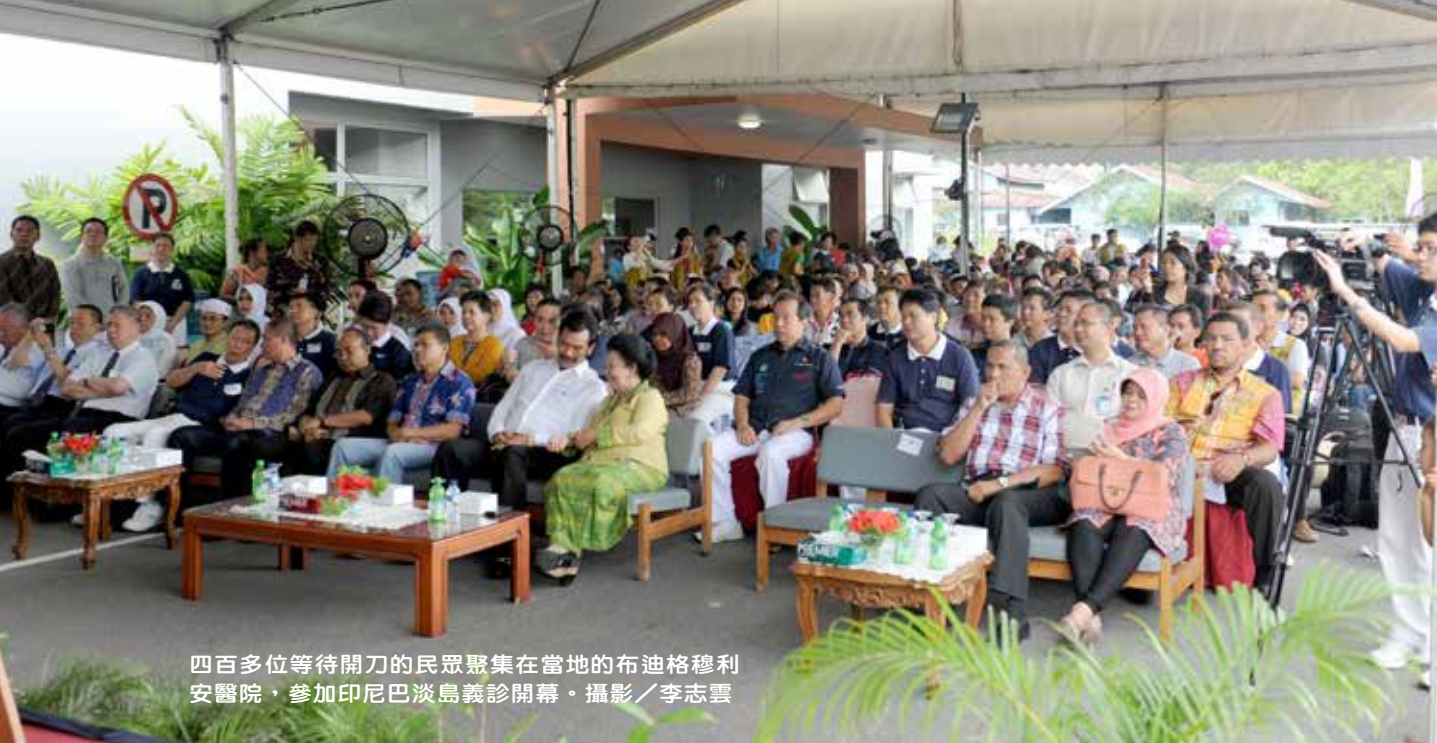
四百多位等待開刀的民眾聚集在當地的布迪格穆利安醫院，參加印尼巴淡島義診開幕。