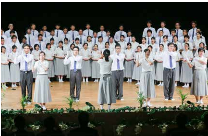
相容性是進入社會職場的最後決勝點，醫病之間溝通的關鍵。圖為醫學系及後中醫學系學生在大體老師感恩追思會上，共同表演手語歌曲《菩薩的化身》，表達對大體老師的感謝。

我們現在的教學方式，雖是愈來愈靈活，但還是脫離不了那種夫子教育與大堂課的模式，但誰受得了啊？缺乏「個人化」的教育方式對於現代這些聰明的孩子而言，很難有吸引力。教導現在的孩子，一定要想辦法讓他自我學習，就是要在WiFi（無線網路）範疇中提供多元課程讓他們選擇。有些人喜歡慢條斯理的老師，有些人偏好表演型的教學方式，各取所需，讓他們發展自己；也要相信他們有能力做適當的選擇。要相信他們，尊重他們，讓他們有機會犯錯；我們不都是從錯得愈厲害之處，學得愈深刻嗎？