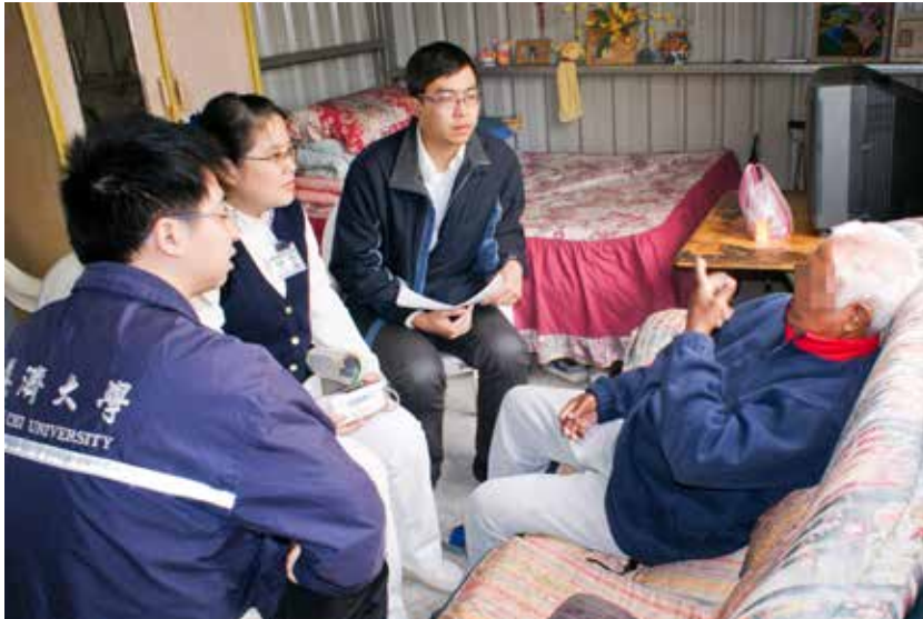
親眼「看」到的道理往往比聽老師「說」更往孩子心裡去，也更有影響力。圖為慈濟大學醫學系學生與花蓮慈濟醫院醫護人員一同往診，關心貧苦病患健康。

教育本身就是一個過程，而非一個結果。學位這個結果只是象徵而已。教育是品質的問題，不是量化的問題。如果還是沿用傳統的教育方式，配合我們的文化，面對這麼多元的外部刺激，內心更加空虛，未來的世界將會很偏頗。