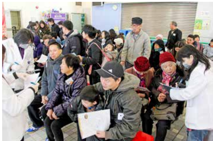
因看診人數頗多，人醫會醫護人員與慈濟志工協助受檢民眾填寫資料。