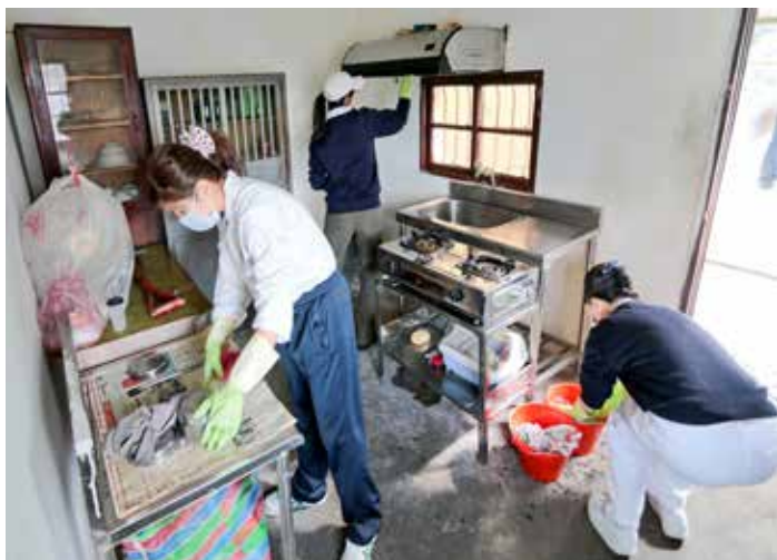
經過跟著一起來服務的「醫師娘」們大展身手後，廚房很快恢復整潔。