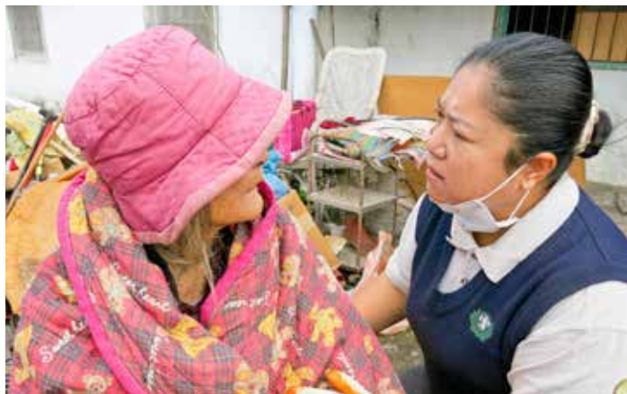
古花妹督導親切的用布農族母語和阿嬤溝通，終於讓阿嬤解開心防，接受大家的幫助。

裡以前很乾淨，現在身體沒辦法了，謝謝你們！」看到阿嬤歡喜的眼淚，讓大家覺得一切的辛苦都十分值得。（文、攝影／陳慧芳）