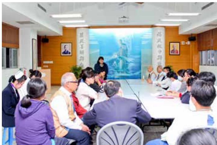
眾人在演習結束後進行會議檢討。