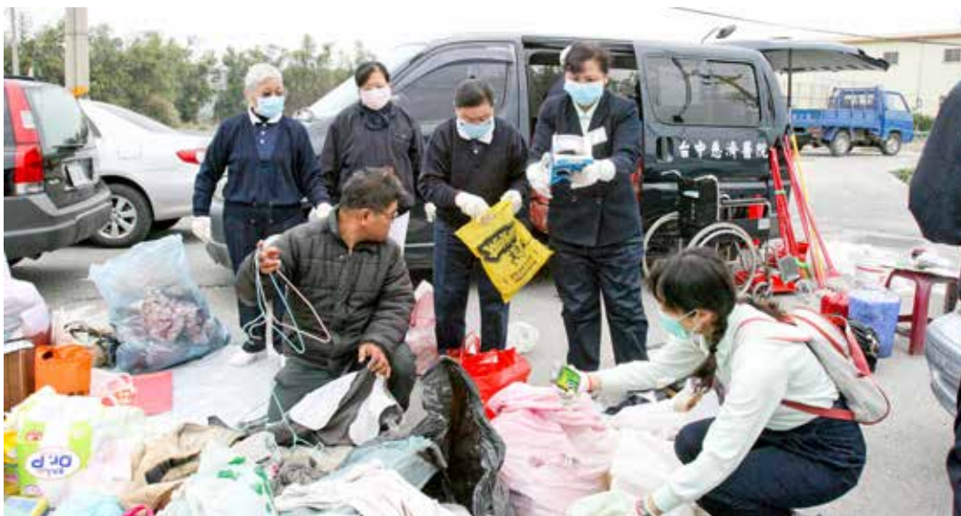
大家合力將物品搬移到屋外進行分類整理。

分有默契地排成人龍接力，一一將物品移往屋外，接著分成三大組整理環境，一組在屋裡清掃擦拭，一組則在屋外分類各項物品，還有一組負責刷洗各式鍋碗瓢盆。簡院長也藉機和同仁分享打掃技巧，叮嚀同仁左右手交替使用才不會腰痠背痛。