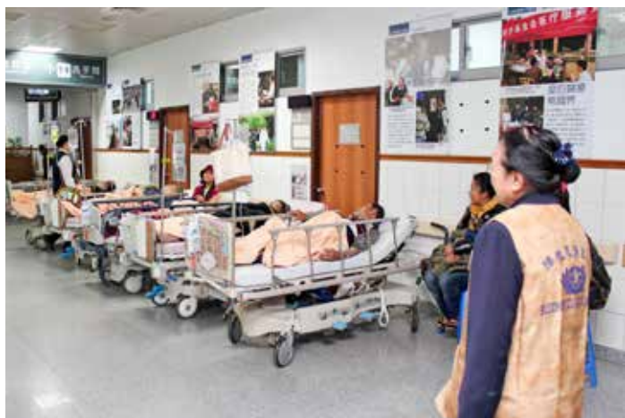
原本的一樓門診區也擴展為急診治療區。