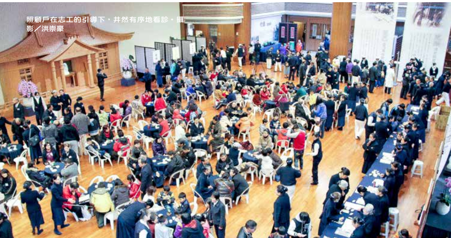
照顧戶在志工的引導下，井然有序地看診。攝影／洪崇豪