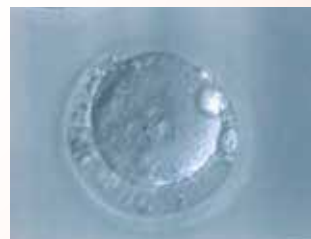
不正常三個前核的受精卵