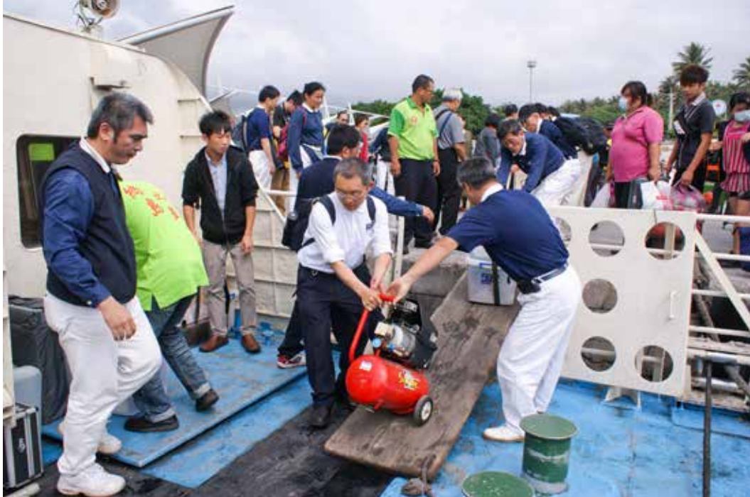
醫療人員和志工彼此接力，快速將設備運送到船上。

政同仁以及慈濟志工組成的義診隊伍，利用四月廿六、廿七日兩天的週末假期提供全方位的義診服務，照顧偏鄉民眾的健康。