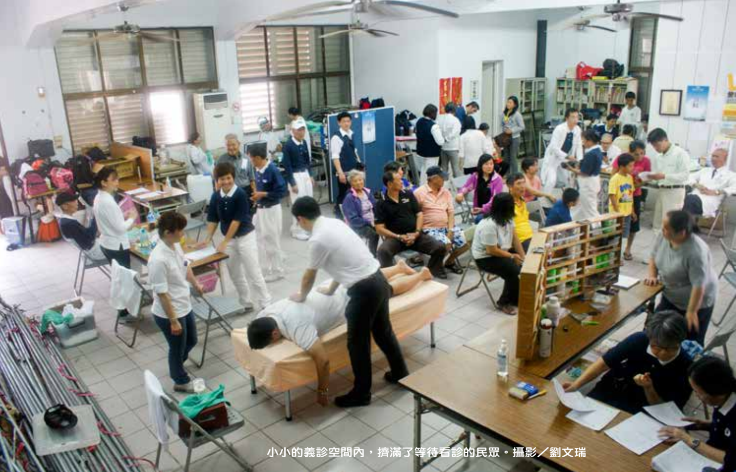
小小的義診空間內，擠滿了等待看診的民眾。