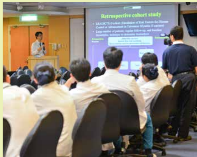
五月十日的「學術研究成果發表會」上，醫、護、藥技等共同分享創新研究。