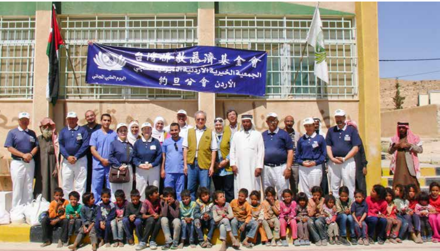
義診團隊感恩有付出的機會，用心讓這次回饋當地的服務能圓滿成功。