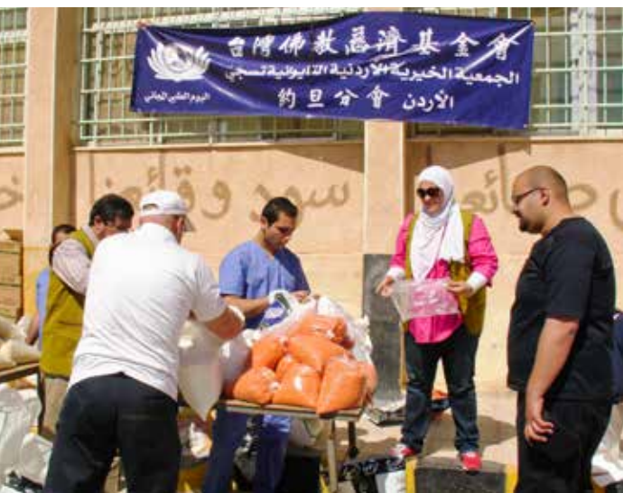
義診發放團隊一抵達現場，立即著手整理所需物資，以利後續作業的進行。