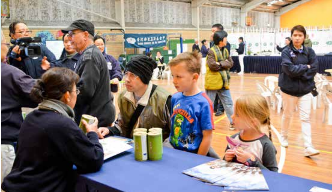
前來接受義診服務的父子，專心認真的聽志工講解竹筒的意義。

球的付出讓她感動。雖然自己現在沒有工作，但平常都有在社區做志工，也很樂意付出自己的一份心力幫助需要幫助的人。當志工問到她是否願意加入慈濟的志工行列，她爽快地回答，「當然樂意！」