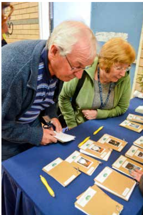
每位牙醫師都有一本專屬的感恩簿，治療後暫時無法言語的民眾可以用筆寫下心情。

材的部分工作。「十七年來的生活衣食無缺，希望他能藉由義診看到人生的另一面，並不是每個人都像他一樣幸福。有些人是要很努力才能勉強生存下去，也希望讓從來只有接受的他開始學習付出。」讓兒子學習團隊合作，在義診中見苦知福，成為手心向下的人，足見爸爸的用心良苦。