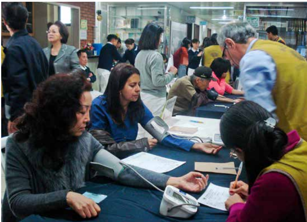
慈濟巴西聯絡處二十二年慶義診活動，華人以及巴西當地民眾均前來求診，人潮擠滿大廳。

當地華人求診的共同問題是因為語言不通，醫生問診時常是雞同鴨講，來自大陸的新移民更有很大的溝通障礙。人醫會的醫師們精通數種語言，所以聯絡處特地在周年慶舉辦華人義診，帶給僑胞很大的幫助。義診服務項目包括內科、婦科、耳鼻喉科、皮膚科、小兒科、心臟科、眼科、牙科、中醫針灸、氣功，以及超音波檢查、眼科技師驗光、心電圖、測量血壓血糖、子宮頸抹片檢查，另外還有心理諮詢、法律諮詢和義剪等。