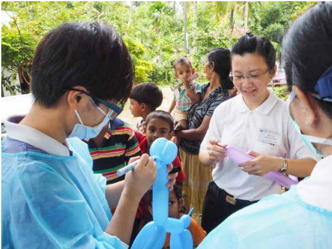
醫護人員除了施醫施藥，還動手將氣球製作成可愛動物造型，將歡樂帶給小朋友。

三十四歲的拉姆雅拉姐近視高達一千四百度，因付不起五千盧比（約合新臺幣一千元）的眼鏡而作罷。她育有五個孩子，但無法教導孩子讀書寫字，感到非常無奈。領取眼鏡後讓她可以清