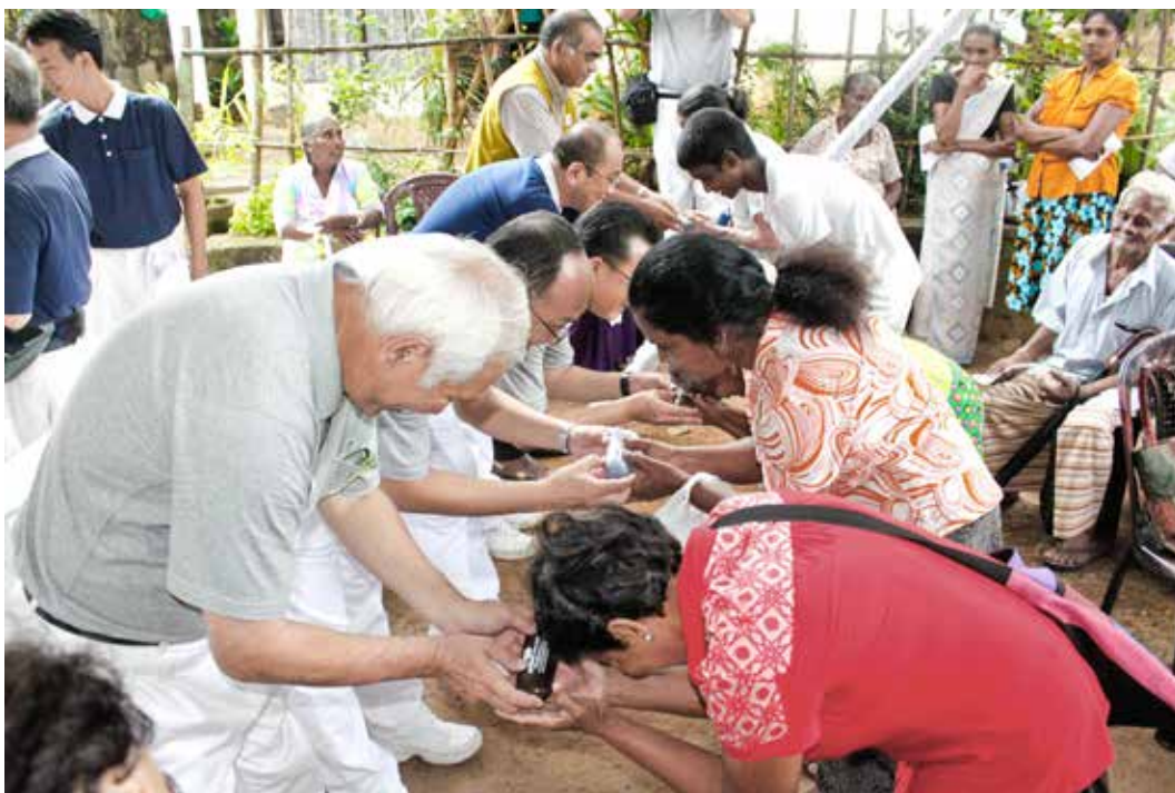
實業家們九十度鞠躬，以恭敬的心為民眾發放眼鏡。

民可以步行或搭乘慈濟提供的短程巴士到現場。在等待區，志工庫馬拉介紹慈濟竹筒歲月的精神，以及慈濟在斯里蘭卡的慈善足跡。