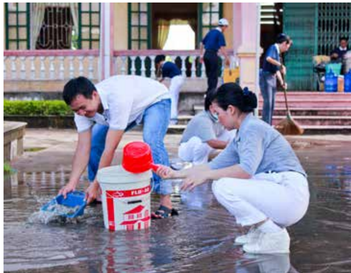
義診場地的國小廣場前天下雨，志工合心協力打掃，清除地上的積水。

診間門口掛上示意圖標明科別，再以數字代表診房代號，方便辨識。診間內，醫師們為民眾檢查視力、耳朵和牙齒等項目，更免費提供老花眼鏡。因為二十八歲的女兒阮氏榮患有小兒痲痺不良於行，還有些微氣喘，負責照顧她的