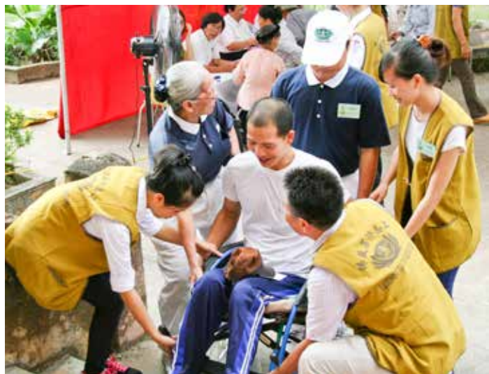
遇到行動不便的病患要上階梯，多位志工合力抬起輪椅。

醫護人員及器材，也安排電視臺全程錄影。九月五日晚間，海陽電視臺於時事新聞中播報了慈濟的兩項活動。