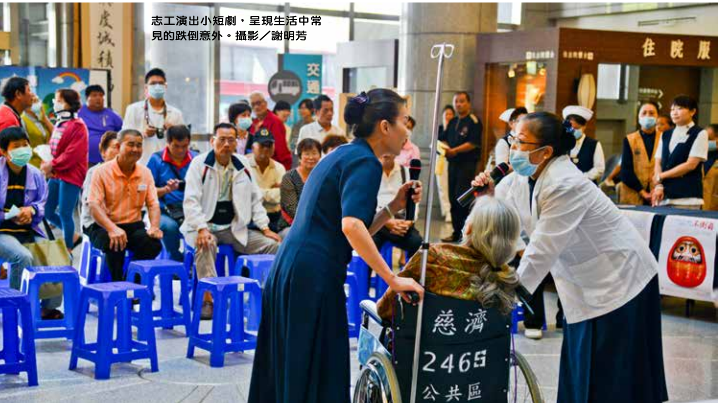
志工演出小短劇，呈現生活中常見的跌倒意外。

「透過園遊會與闖關方式，讓宣導活動變得有趣且淺顯易懂了，能吸引民眾主動了解防跌、用藥安全、勤洗手等基本觀念。」陪母親複診的黃女士，趁著領藥空檔，鼓勵母親參加活動。每月從臺北南下陪雙親回診的林先生，帶著