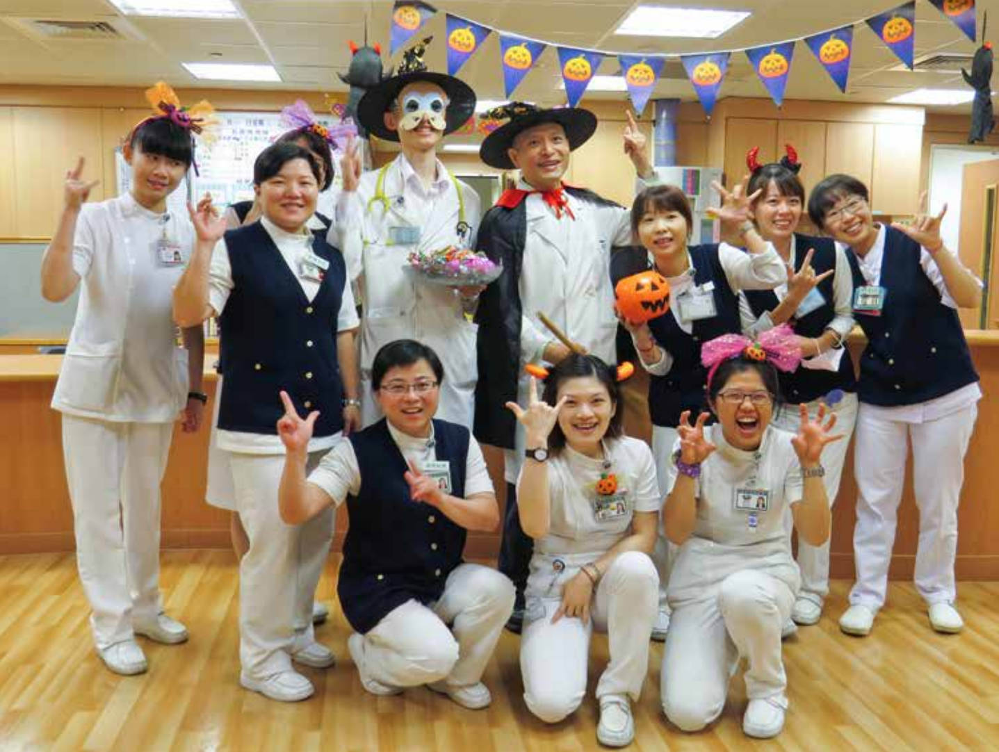
醫護團隊變裝成巫師和小魔女，準備帶給小朋友們驚喜。

說，許多幼稚園與小學都會在節慶安排活動，讓小朋友特別高興，面對這些因生病住院的孩子，醫護團隊不只治療他們的身體，也想藉著萬聖節製造一些驚喜，鼓勵病童用比較輕鬆的心情面對病情，早日恢復健康。