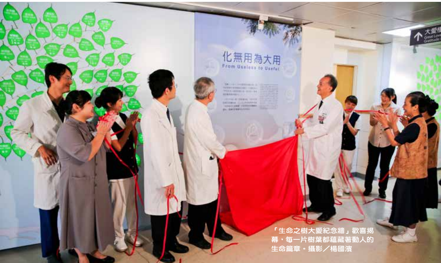
「生命之樹大愛紀念牆」歡喜揭幕，每一片樹葉都蘊藏著動人的生命篇章。

團隊特地選在周末進行施工，避開醫院最忙碌的時刻，器官移植小組與外科病房的護理師也一起加入製作，將一片片印上器捐菩薩的葉子貼上。器官移植協調師施明蕙表示，每貼上一片葉子就想到每位器捐菩薩的生命故事，而這