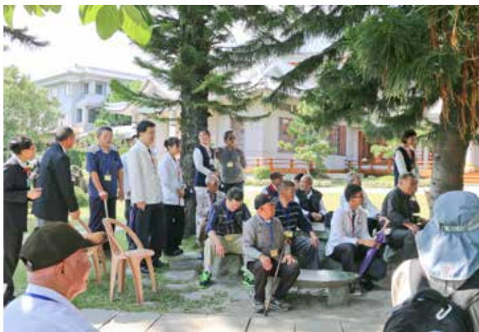
來到靜思精舍，榮民伯伯回想起小時候的溫馨時光。