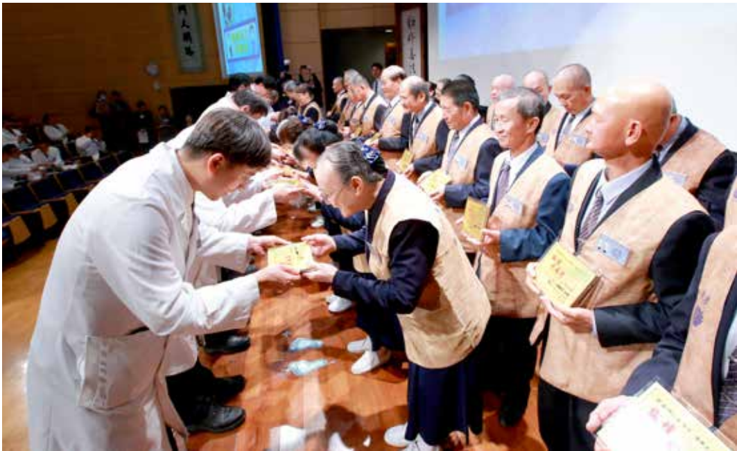
臺北慈院醫師們感恩醫療志工的守護與陪伴。