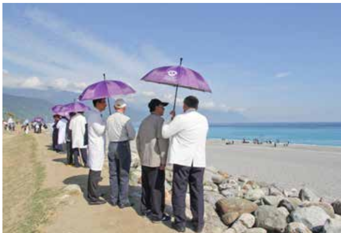
花蓮慈院同步慶祝醫師節與放射師節，邀榮民之家長者到七星潭一遊。

來到靜思精舍，五十多位榮民伯伯坐在樹下聽德如師父介紹精舍的起源。今年一百零三歲的高伯伯表示，好像回到小時候的感覺，除了榮家安排的自強活動，自己已經好幾年沒出門了。特別是