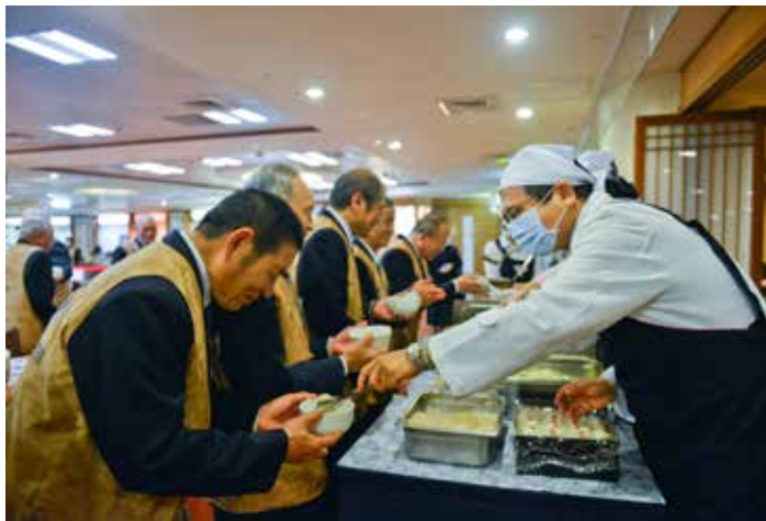
醫師親奉點心感謝志工。