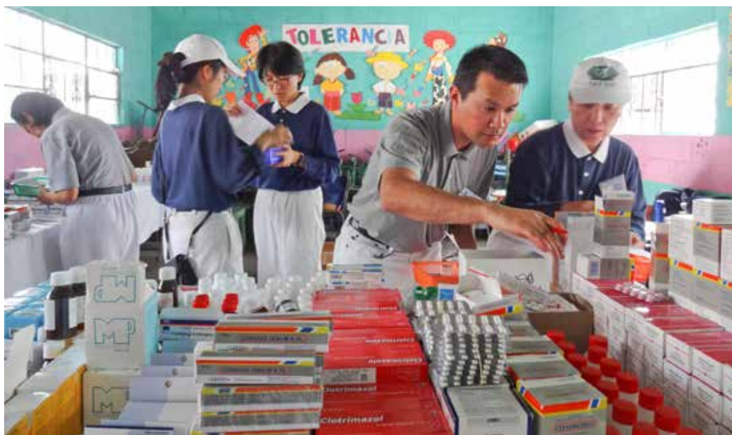
配藥區的藥品擺放按照字母順序排列，讓不諳藥性的志工也可以照著看診單進行配藥。