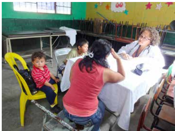
此次義診的家醫科診療包含小兒科，讓一家人可以同時就醫，不必四處奔波。

此次為慈濟在瓜地馬拉所舉辦的第二十次義診。來自首都的四十位志工，包括慈濟委員、本土志工以及替代役男等，星期日早上七點半於市政府門口對面集合，然後再一起前往義診場地；市政府當局也派出十二位支援人力。聖塔蘇菲亞社區公立小學位於聖荷西比奴拉