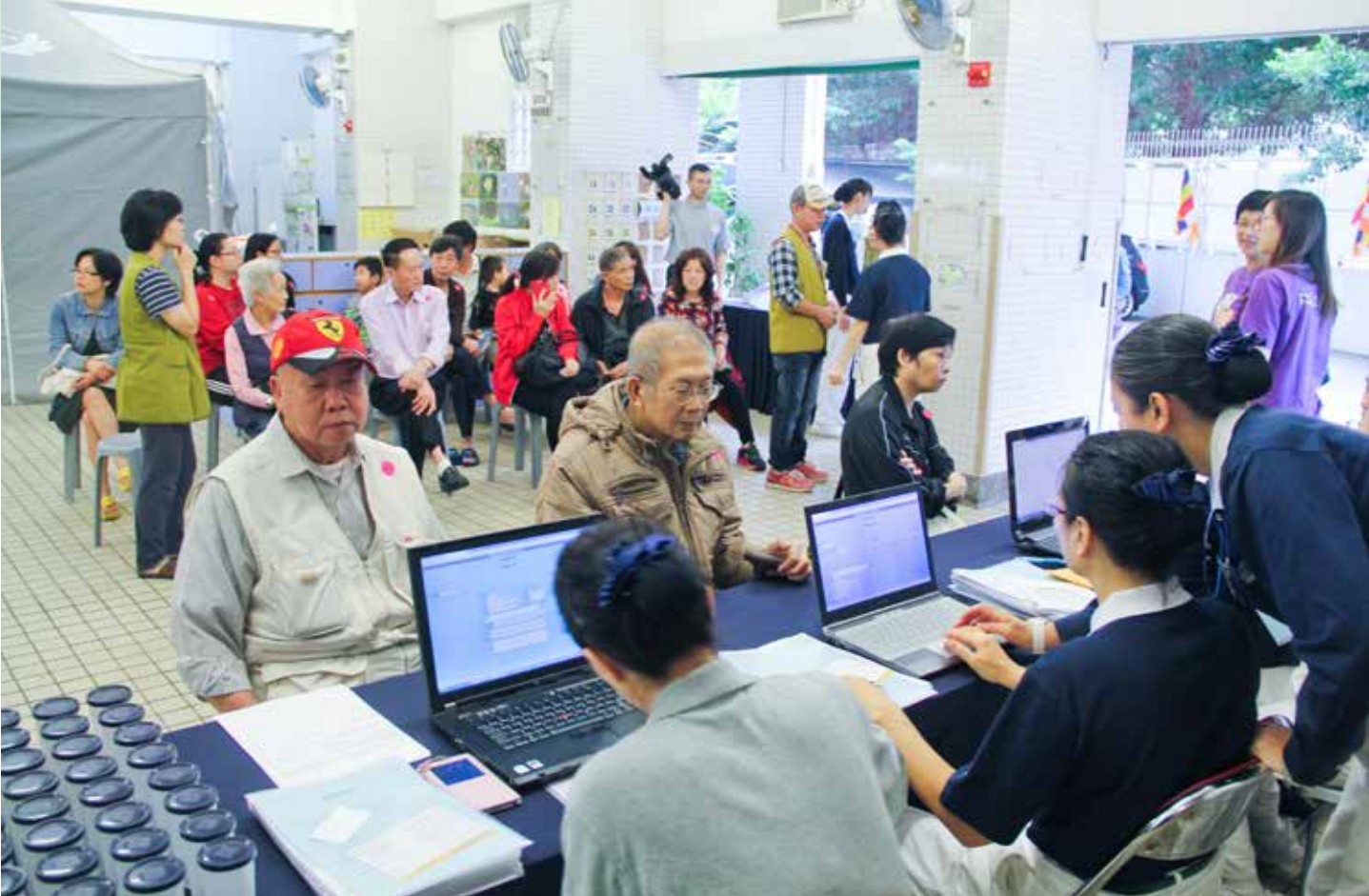
慈濟香港分會與鄰舍輔導會在東涌合辦義檢活動，志工協助民眾進行掛號。