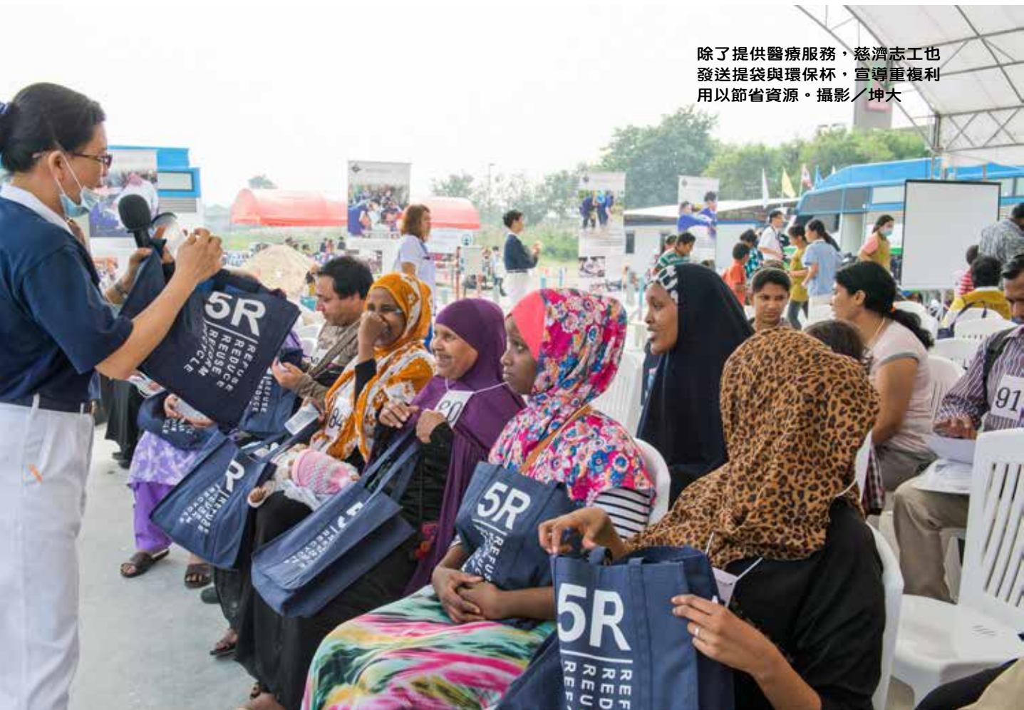
除了提供醫療服務，慈濟志工也發送提袋與環保杯，宣導重複利用以節省資源。攝影／坤大

平常在泰國當地的志工和醫護人員，都以泰文為主要溝通方式，可是此次的醫療服務，大家都面對多國籍的語言挑戰。以難民署提供的資料來看，在曼谷的難民鄉親來自五十個不同的國家，所以活動當天，有近七十位翻譯志工，協助翻譯烏爾都語、阿拉伯語、越南語、索馬利語、泰米爾語、柬埔寨語、法語、波斯語和苗語等九種語言。雖然語言無法直接溝通，大家仍然透過笑容、以愛互動，讓義診現場處處溫馨、順利進行。