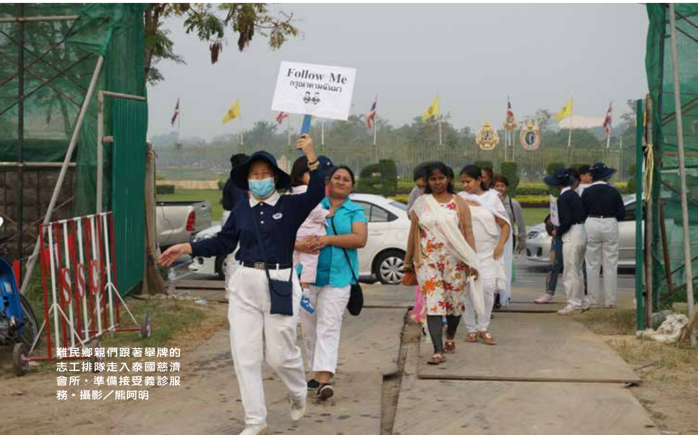
難民鄉親們跟著舉牌的 志工排隊走入泰國慈濟 會所，準備接受義診服 務。

泰國首都曼谷在政府努力推動之下，被世界各地公認為旅遊天堂。可是在繁榮的城市裡，還有一個黑暗的角落，就是流離失所的「難民與尋求庇護人士」。二〇一四年三月三十一日，美國駐泰國大使館人員首次蒞臨慈濟泰國分會，表示從二〇一三年開始，大批難民湧進曼谷，根據聯合國難民署 (UNHCR) 的統計，人數從二千多人躍升至八千五百六十人。家破人亡的難民離鄉背井來到曼谷，泰國政府又無法提供任何的補助，一旦生病，要到何處求醫？