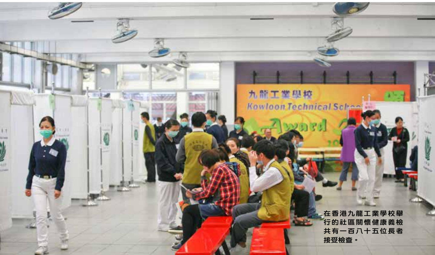
在香港九龍工業學校舉行的社區關懷健康義檢共有一百八十五位長者接受檢查。

九龍工業學校有四十位學生參加此次義檢，目的是陪伴阿公阿嬤等候看醫生，還有就是在過程不發生跌倒等意外。