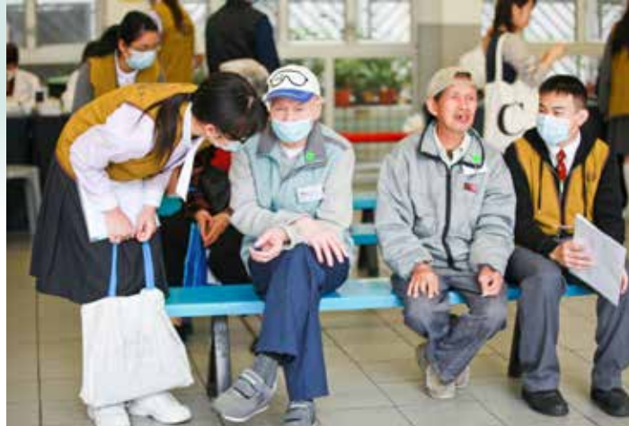
九龍工業學校有四十位學生穿上背心參與此次義檢，在等候期間，同學都會陪伴阿公阿嬤閒話家常。