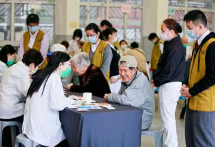
慈濟人醫團隊耐心為長者解說身體狀況，並叮嚀留意事項，讓他們感到備受關懷。