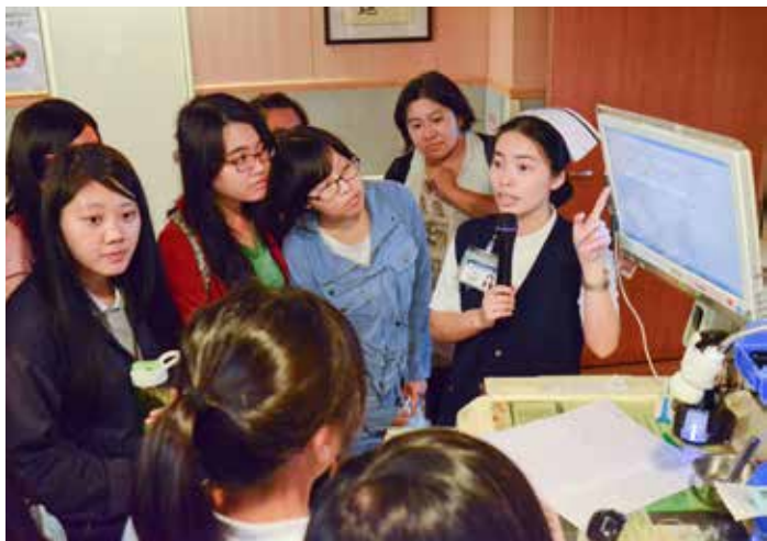
護理部主管帶領學生參訪病房區，並介紹行動工作車的使用方式。

姊的陪伴下，同學們近距離看了工作場域，並了解住宿環境，不少人都相約要在這裡工作一起當室友，現場歡笑聲不斷。