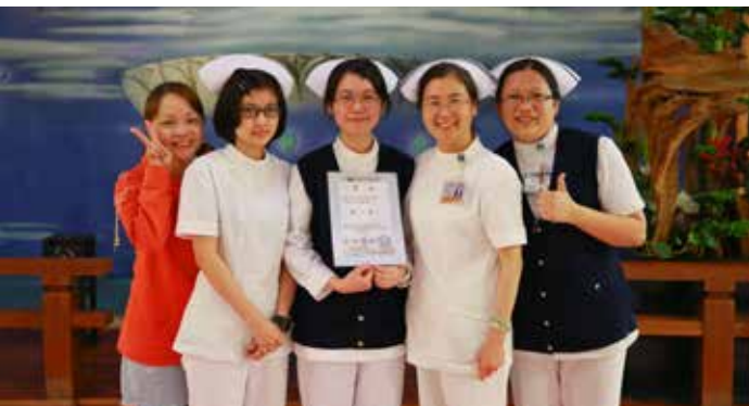
合心十一樓整形外科病房製作的「天使心護病情」，獲得第一名的好成績。