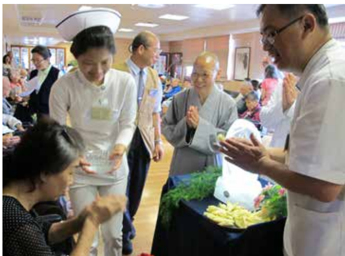
德旭師父(上圖)與德俊師父(下圖)引導病患及家屬利用行動浴佛檯浴佛，祈求身體健康平安。