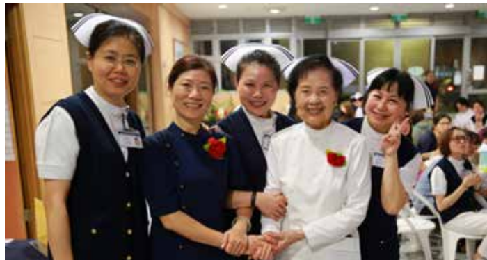
護理部主管感恩懿德媽媽，歡喜合影。

家屬的一封信，讓她重新審視護理的價值與生命的可貴。用心拍攝與細膩的說故事方式，因此獲得第一名的好成績。