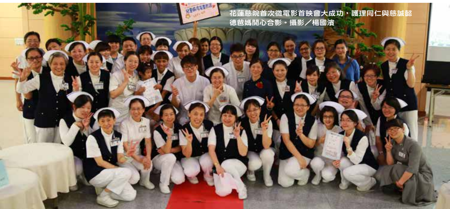
花蓮慈院首次微電影首映會大成功，護理同仁與慈誠懿德爸媽開心合影。

「一個意外來的包裹及一封感謝的信，當手上握著那張薄薄的紙，心中卻感到如此的沉重，因為後來奶奶去當天使了。」由整形外科團隊製作的「天使心護病情」影片，描述年資只有一年的護理師，在照護病人的過程中發生「綠色九號」，內心的自責卻因為