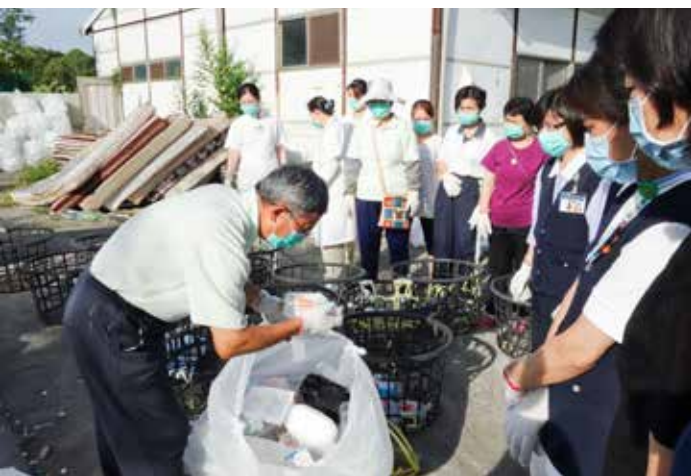
資源回收前，同仁專心聆聽志工說明分類方式。