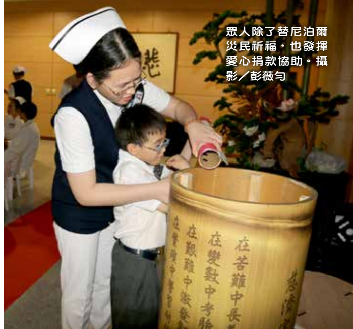
眾人除了替尼泊爾災民祈福，也發揮愛心捐款協助。