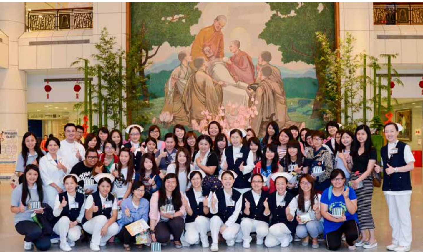
眾人於佛陀問病圖前開心合影，期許同學未來都能朝著護理之路邁進。

短暫的參訪，在同學心中留下深刻印象，許多人回到會議室就開始填寫履歷表，或與護理部主管合影留念。臨行前，護理部廖如文副主任親自送上象徵「包中」的粽子吊飾，期勉同學們能在國家考試中一舉勝利，同時也歡迎同學們加入，一起為守護生命而努力。(文／葉怡君)