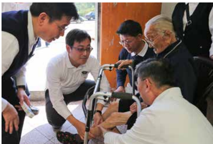
除了定點義診，人醫會團隊也前往居家訪視行動不便的長者。