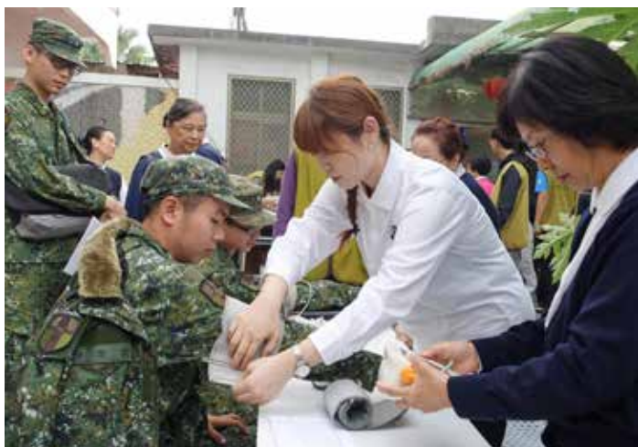
難得的金門義診，國軍也把握機會來參加。圖為護理師為國軍測量血壓。