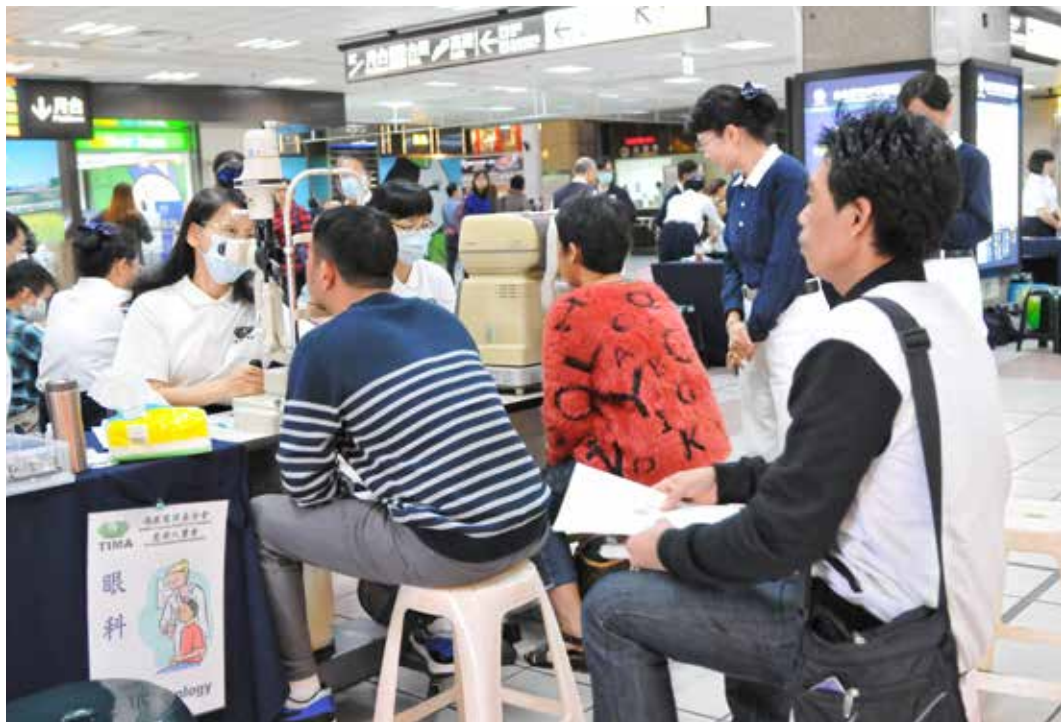
人醫會志工為外籍勞工朋友視力檢查。

暖冬午後的臺北火車站，共有一百八十位醫護人員和志工前來，參加義診的外勞朋友則有一百一十五位。離鄉背井的他們，在人生地不熟的臺灣為陌生的家庭付出、奉獻，慈濟人醫會透過義診，希望讓他們在異鄉能有依靠，把臺灣當成一個可以慢慢融入的「家」。