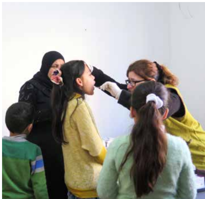
一次進來一戶人家，希望照顧子女的健康，為單親媽媽減輕一點點負擔。