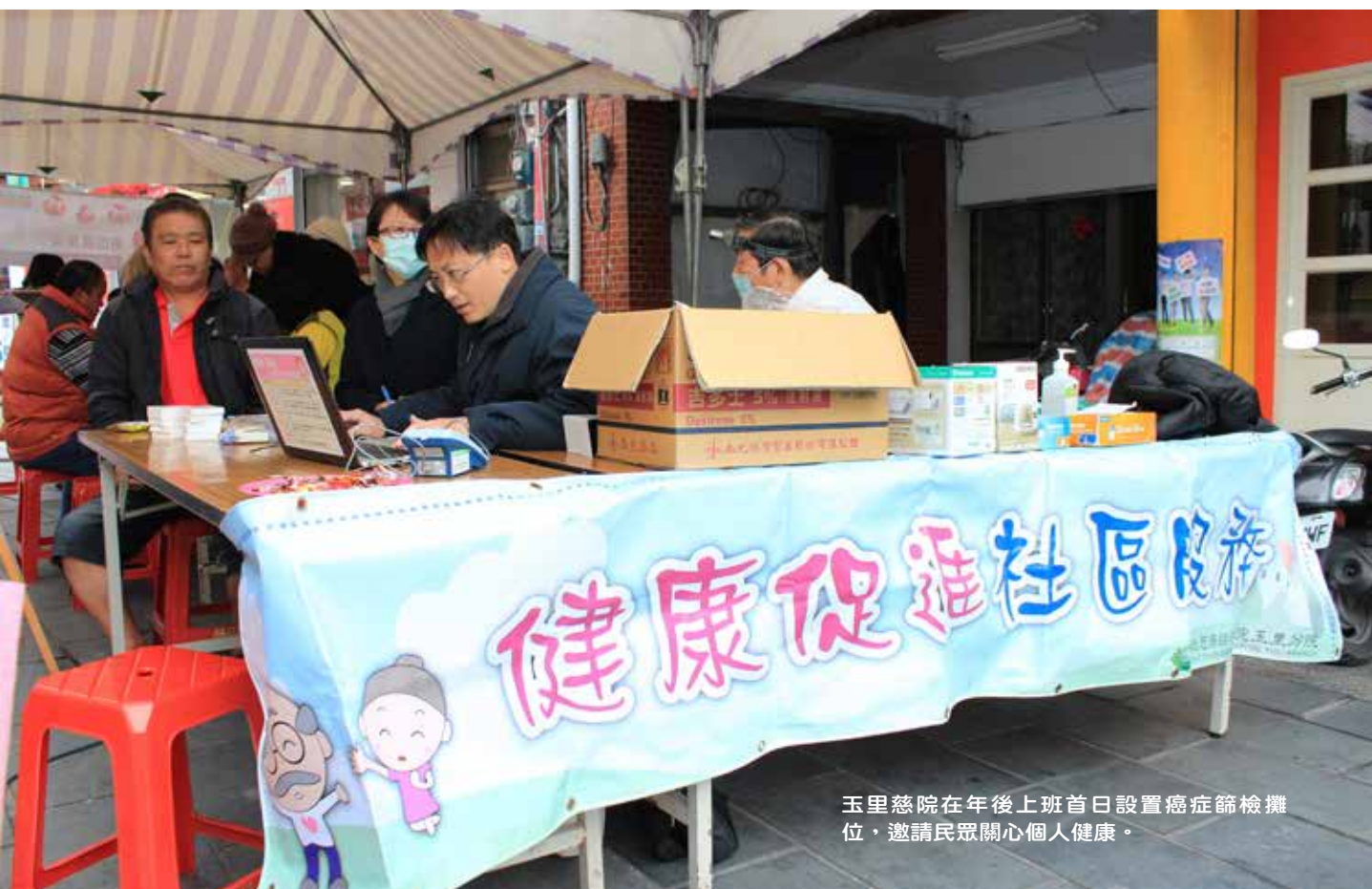
玉里慈院在年後上班首日設置癌症篩檢攤位，邀請民眾關心個人健康。

小鎮醫院社區健康促進無假期，在新年開工頭一天，就積極善用社區活動的因緣，以符合鄉親需求的方式來為眾人健康把關。這除了是用心實踐無圍牆醫院的好做法外，也期望透過社區篩檢活動的持續推廣，能讓鄉親改變過去「不檢查就沒病」的舊思維，主動參加醫院所舉辦的篩檢活動，培養定期參加健康篩檢的好習慣。（文、攝影／張哲卿）