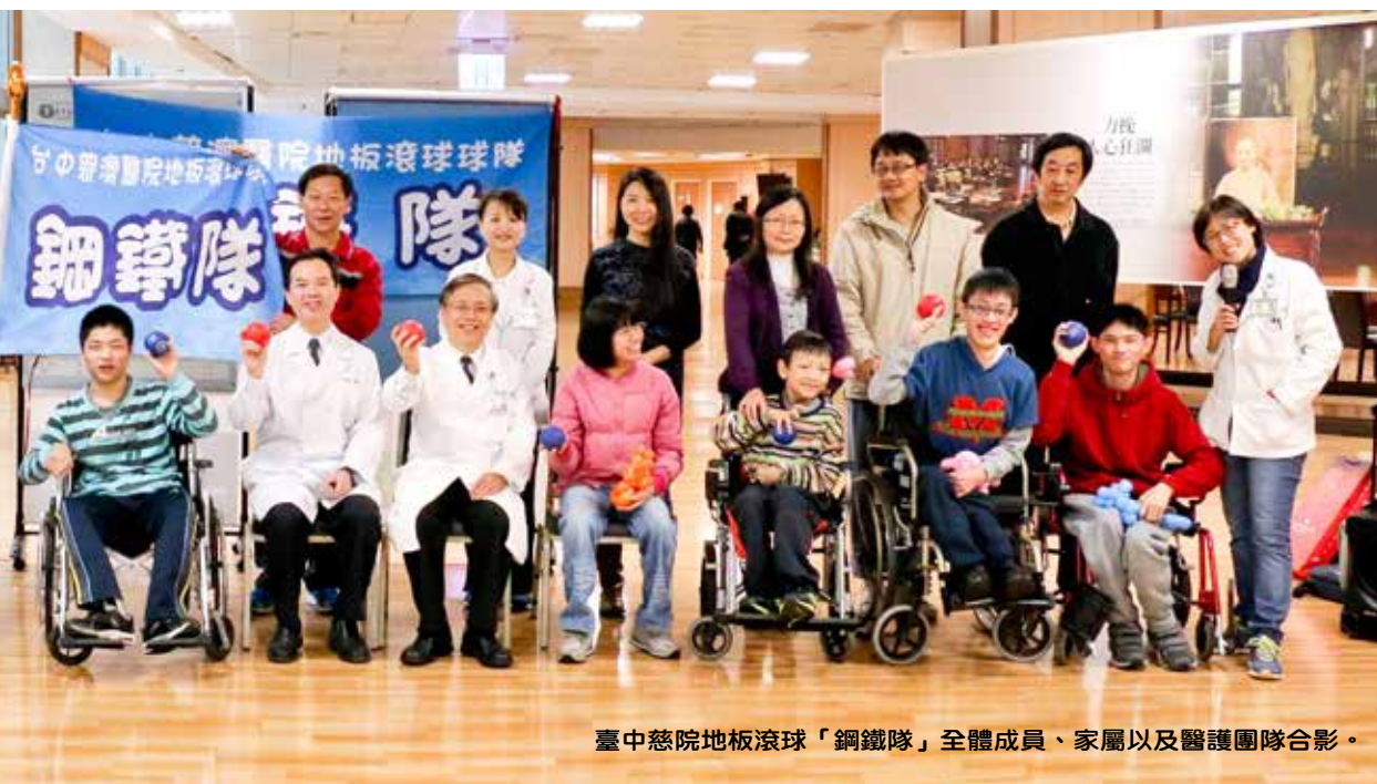
臺中慈院地板滾球「鋼鐵隊」全體成員、家屬以及醫護團隊合影。

簡院長將象徵鋼鐵意志的鋼鐵隊旗授與球隊，由王柏凱代表接受，蔡主任也當場贊助球隊基金，希望未來鋼鐵隊可以進軍國際，為國爭光。