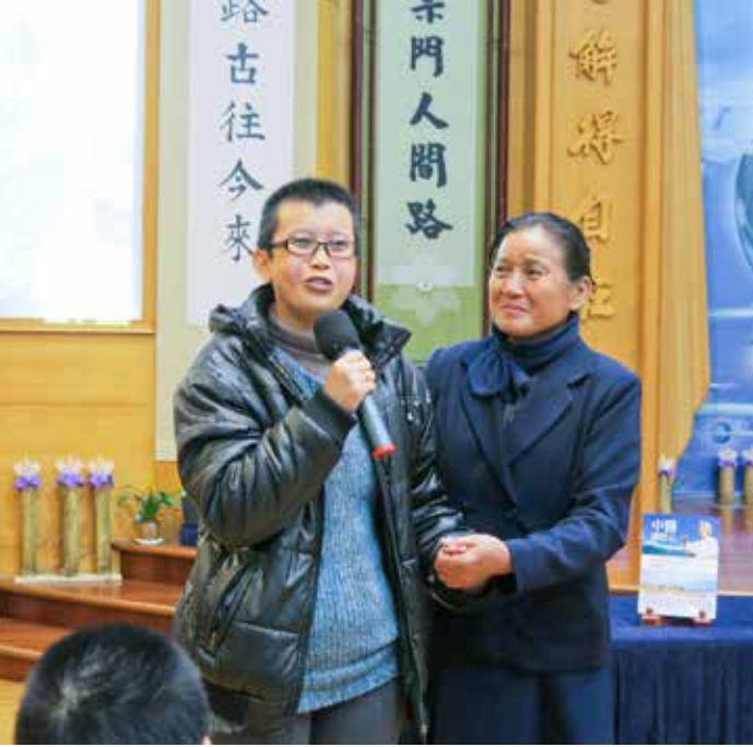
去年中風的四十三歲吳小姐（左）在慈濟志工的陪伴下現身說法，請民眾注意自己的飲食習慣。