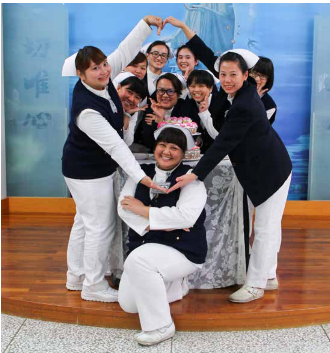
護理師俏皮地歡慶玉里慈院十七歲生日。

院慶感恩會的最後，張院長邀請所有的嘉賓共同切下蛋糕，祝玉里慈院十七歲生日快樂。🍷