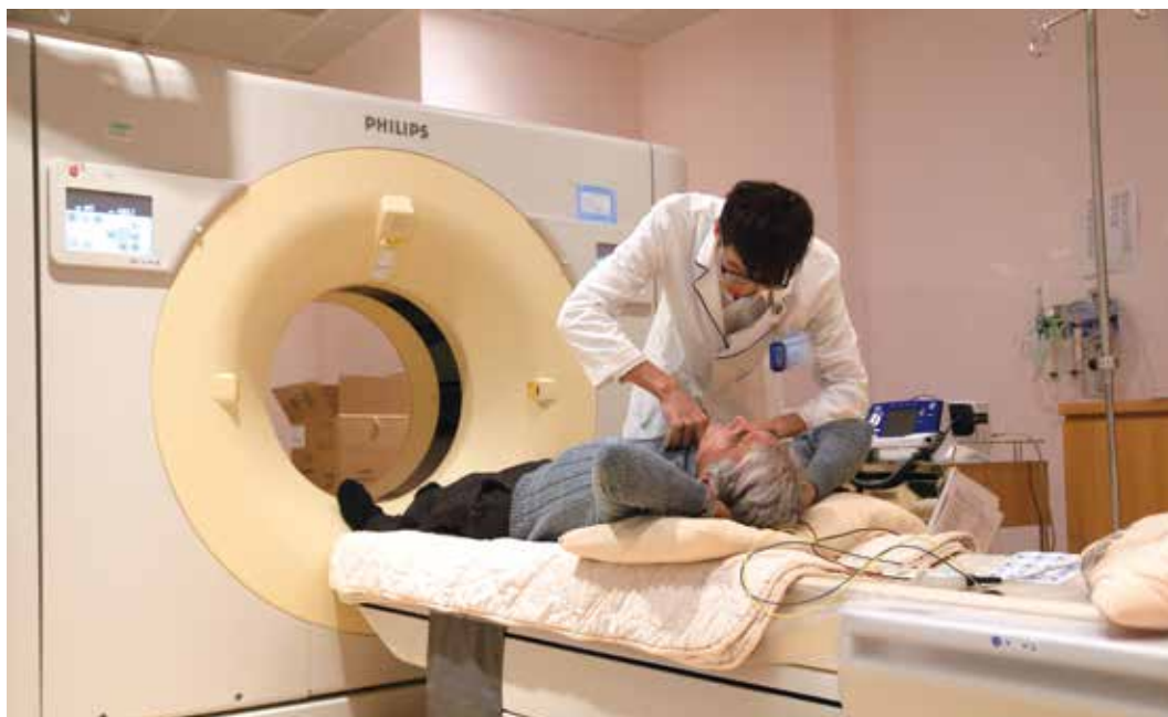
玉里慈院引進新式二五六切電腦斷層掃描設備。

是透過一張張的放射影像，來說明高端「二五六切」斷層掃描儀器精細的影像品質，能夠協助醫師做最正確的醫療判斷與處置，並可降低醫療輻射達百分之八十以上。