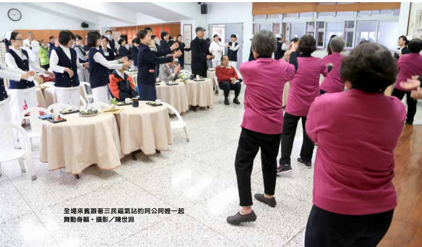
全場來賓跟著三民福氣站的阿公阿嬤一起 舞動身軀。攝影／陳世淵

玉里慈院引進的新式二五六切電腦斷層掃描儀，平均掃描一次僅需零點二七秒，適用在無法閉氣的重症病患或嬰幼兒，能大幅減少假影，建構清晰的平面或立體影像。張院長表示：「在醫療上，我們希望還沒有發生症狀的時候，就能夠偵測得到。非常感恩證嚴上人的慈悲，在山間的小醫院也擁有跟醫學中心同等級的電腦斷層，連來裝設機器的工程師都非常讚歎。」