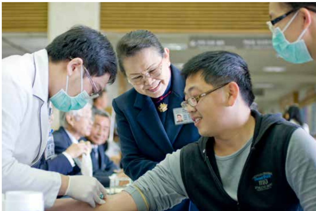
在花蓮慈院大廳舉辦造血幹細胞捐贈驗血活動，由醫檢師抽血。