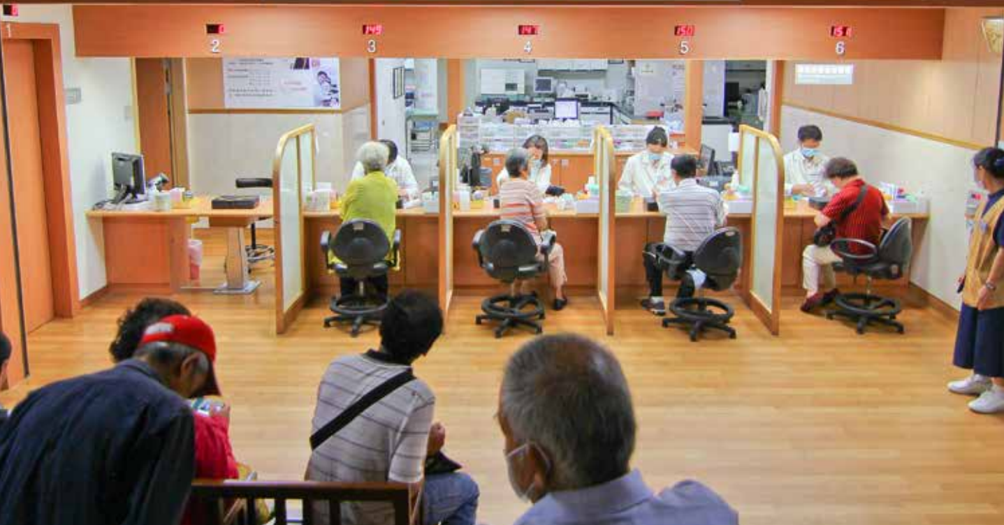
花蓮慈院二樓抽血櫃臺。