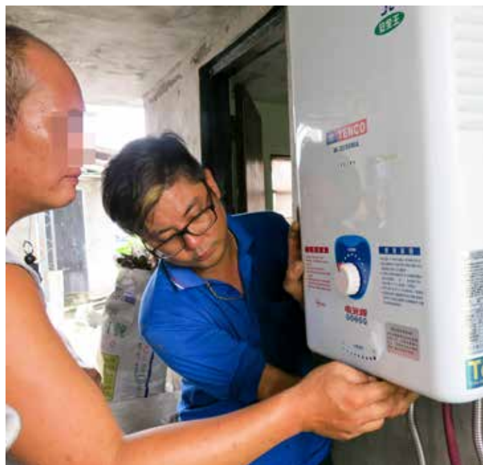
熱水器安裝完成後，技師耐心帶著林先生患有視障的二兒子熟悉熱水器操控的「觸感」。

中秋節前夕，關山慈院帶著醫療專業與志工團隊用心關懷社區，期待每一顆用愛心製作的微笑封餅，能為貧病受苦的家庭帶來幸福。（文、攝影／陳慧芳）