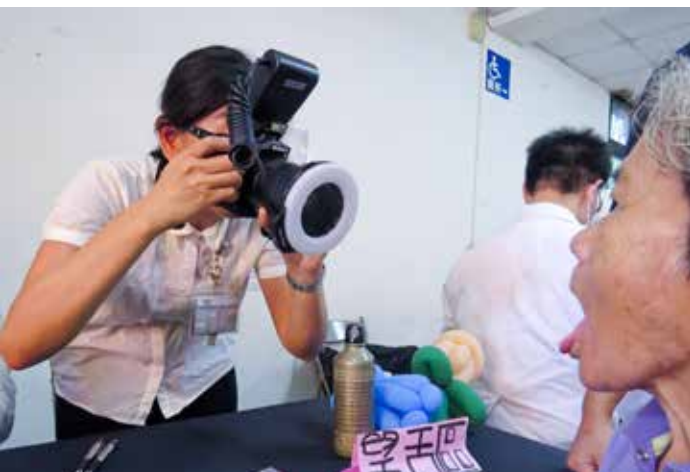
中醫師用相機記錄每一位長輩的舌頭狀況，作為診斷的依據。