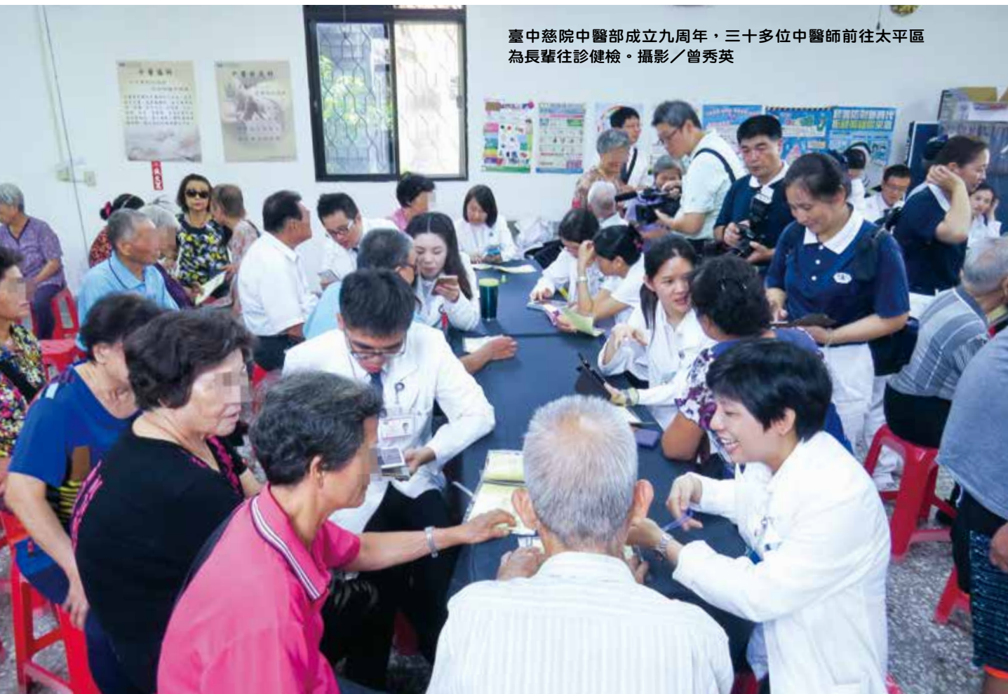
臺中慈院中醫部成立九周年，三十多位中醫師前往太平區為長輩往診健檢。

十月二日一大清早，中醫部內婦兒科加上針傷科等，共計三十多位中醫師總動員，齊聚社區活動中心。太平區志工及中區懿德爸媽則是更早開始布置，精緻點心、健康飲品，五彩卡通氣球，