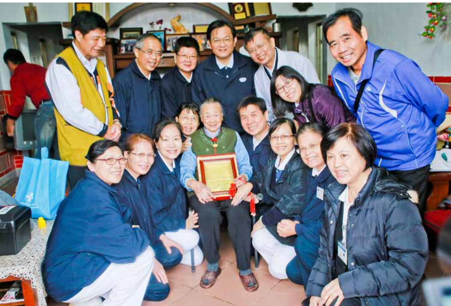
北區人醫會團隊前往訪視關懷，與老菩薩開心合影。

很投入、很付出。以後有機會，我還要繼續參與義診活動。」徐榮源副院長也表示，很開心今年有三位年輕的醫師加入行列，期盼這些愛的種子種下後，能持續成長、茁壯，影響更多的人，讓有志之士一起加入離島偏鄉關懷行列，讓大愛不斷蔓延。徐副院長並期許，「希望透過我們的影響，未來能讓金門當地的醫院、醫師主動效法，建立起當地的義診團隊，就近照護鄉親的健康。」🌱