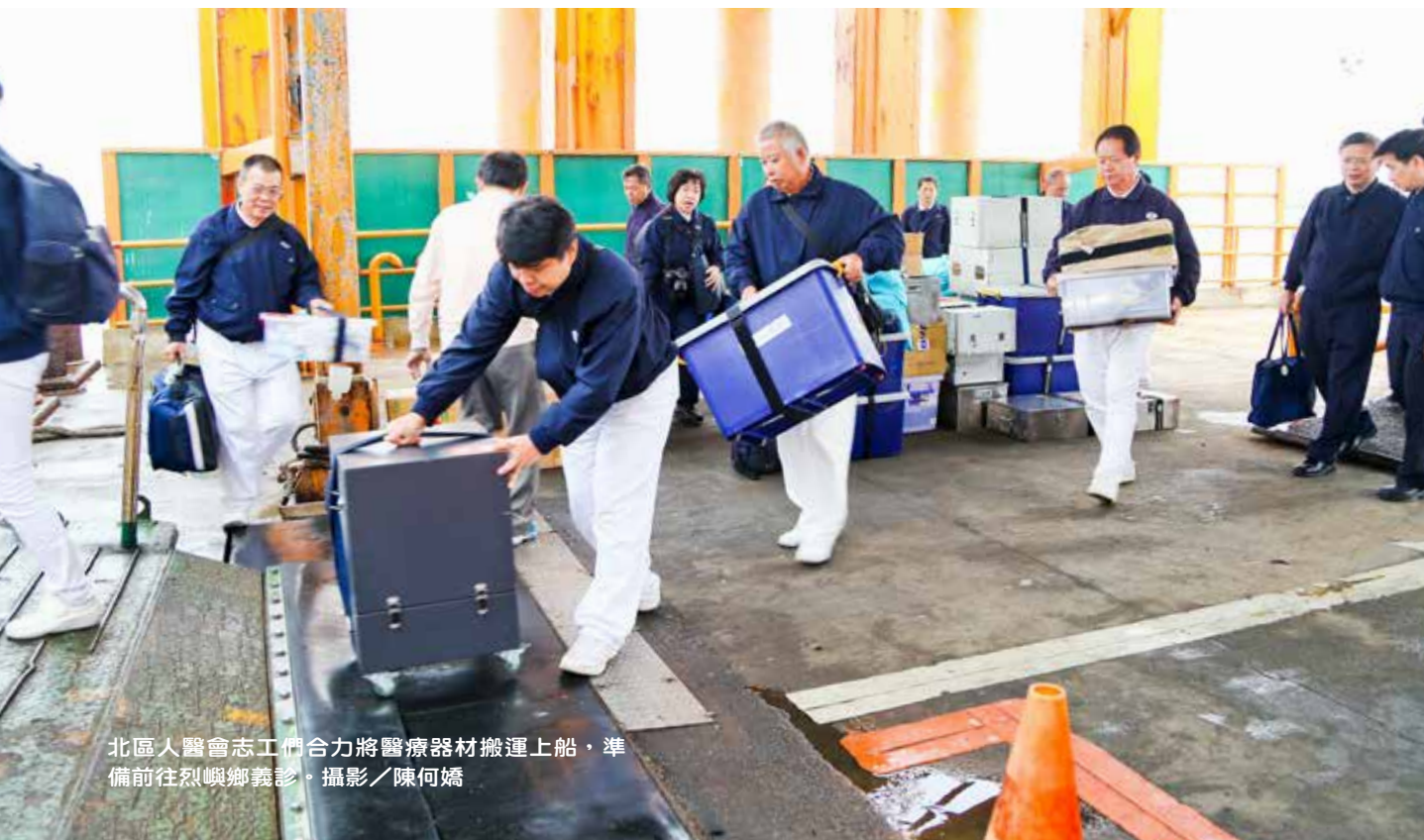
北區人醫會志工們合力將醫療器材搬運上船，準備前往烈嶼鄉義診。