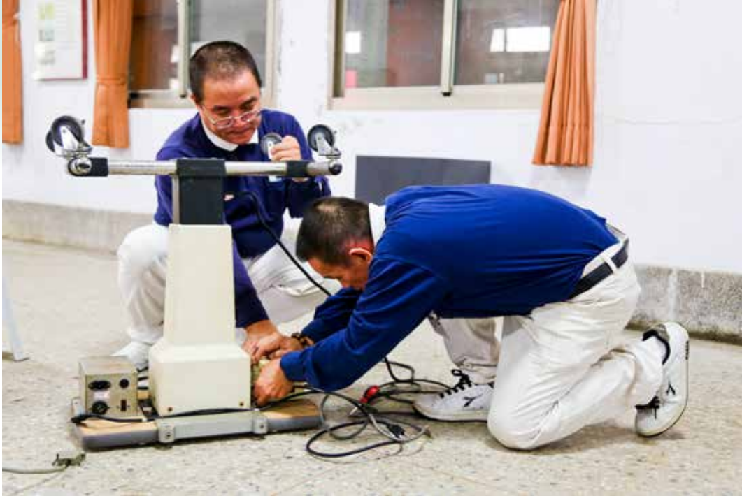
義診總能見到後勤志工專心組裝醫材設備的身影。

北區人醫會召集人，負責統籌運作的任務，這是他第四次來到金門參與義診。經過前幾次的義診，他了解到當地的狀況，也明白金門鄉親對於中醫的需求。為了提供在地居民更完善的醫療照護與關懷，徐副院長希望藉由大家的力量，在金門設立窗口，建立起固定的模式，整合金門醫療資源，並邀請中醫師定期往診，以及提供當地教養院等弱勢族群所需的協助。