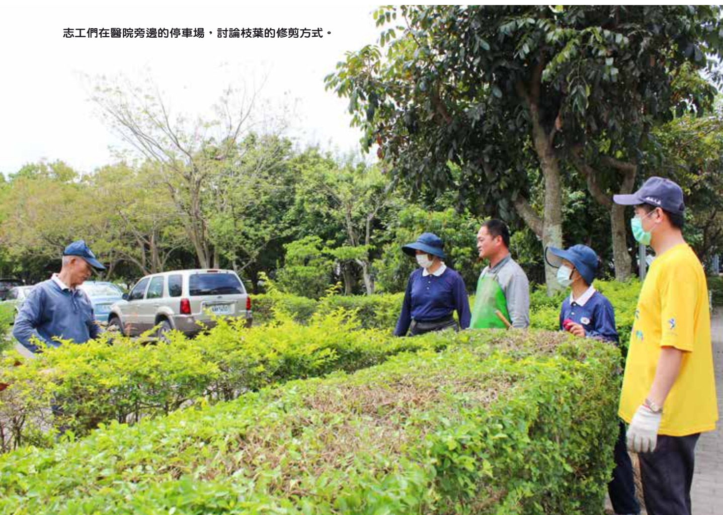
志工們在醫院旁邊的停車場，討論枝葉的修剪方式。

總務股陳靖驊組員表示，醫院每週一、三、五都會發起半小時的全院掃街活動，不過由於同仁業務繁忙，維護的程度和規模始終有限。感恩每年來訪的彰化志工們齊心付出，不僅發揮專業打理花木，也協助整頓環境，這一陣子適逢草木葉落季，修剪正得時，院區植物經由師兄姊們的綠手指美化後，生長將更為強壯、耐風雨，颱風季來臨時也不用太擔心。感恩五位志工菩薩流汗耕耘、共同守護玉里慈院家園。（文、攝影／洪靜茹）