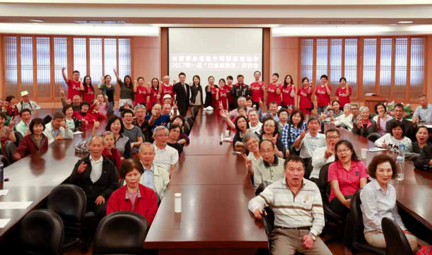
首屆巴金森病友研討會，病友們進行口頭報告與海報發表，分享他們圓夢的過程。