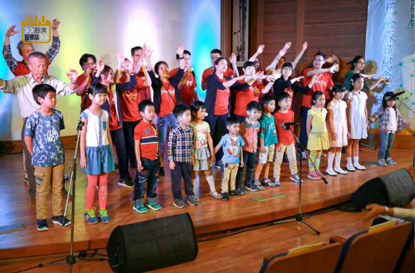
花蓮慈院同仁和子女組成的「3M室內樂團」合唱〈愛很大〉，祝福巴金森病友。攝影／楊國濱

的病友夫妻檔溫馨獻唱。他們秀出不受病魔限制的人生，突破歌舞極限的表演，感動了全場的觀眾。