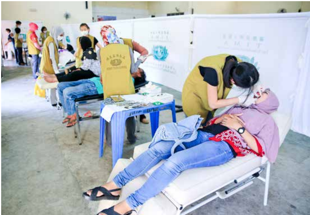
此次義診的醫療服務包括眼科、牙科、中醫、口服蛔蟲藥、肺結核體檢、營養諮詢和足部護理等項目。