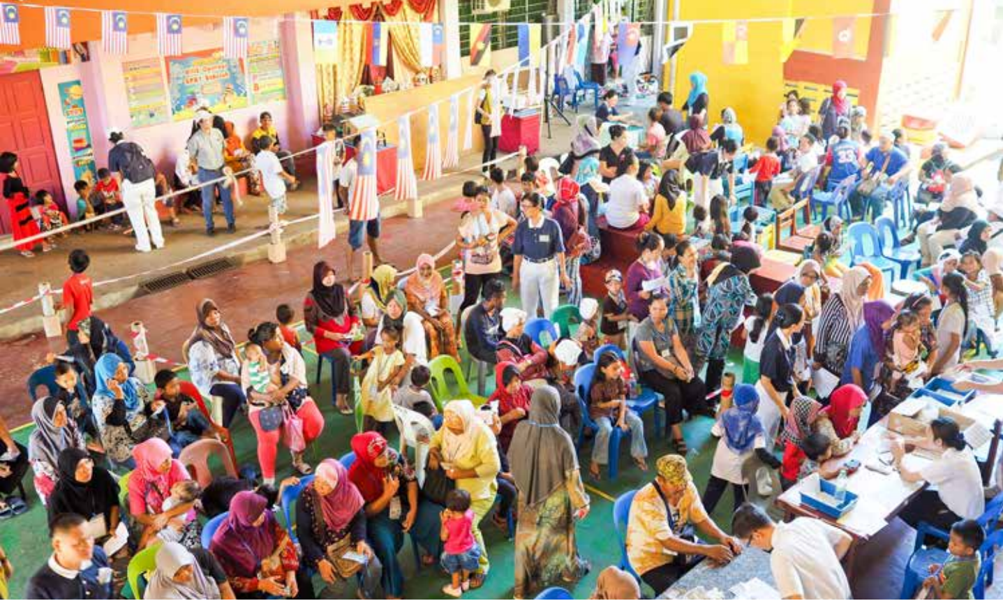
義診場地選在甘榜狄丁岸國小，兩天一共服務鄉親近三千人次。

和自願警衛隊組長的陪伴，共同向村民們宣導此次義診活動。組長拿閩表示，村民沒有證件，生病只能花錢到藥房買藥，慈濟能來義診是件好事，因此他樂意來協助。鄉委會主席和自願警衛隊組長的出現，無疑為這個活動打了一劑強心針。