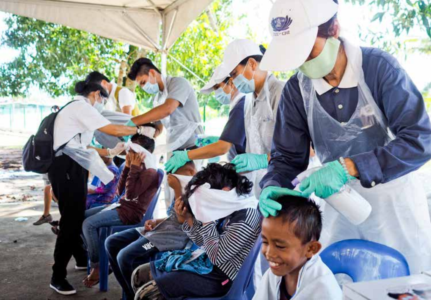
許多孩子都有蛔蟲及頭蝨問題，志工為他們洗髮、滴藥，做衛教。攝影／文偉光