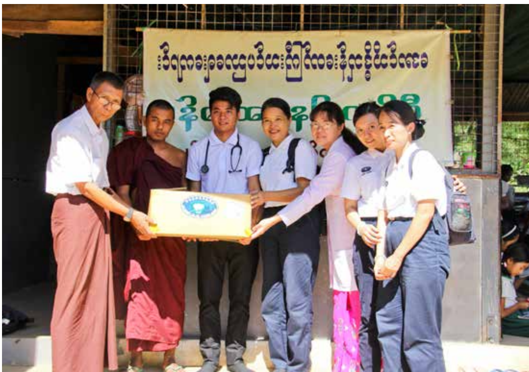
義診結束後，人醫會成員將藥物捐贈出來，期盼造福更多人。

長與學生來到這裡，希望他們都可以獲得診療。一旁的志工們，也協助醫護人員安排部分學生聆聽衛教；學生們都靜靜地坐著，專心地吸收保健知識。