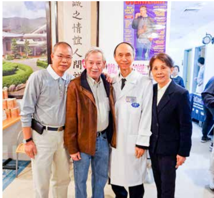
到場致意的布碌崙四十九區眾議員白彼得（左二）表示，看過許多義診，「但從沒有像慈濟科別這樣多、規模這樣大的。」。

四十二歲的葉先生從福州來美十多年，獨自一人生活，得知有義診便前來諮詢就診。他移民來美後，一直在餐館整日超負荷工作，幾乎全年無休；半年前工作時左半身突然失去知覺，難以動