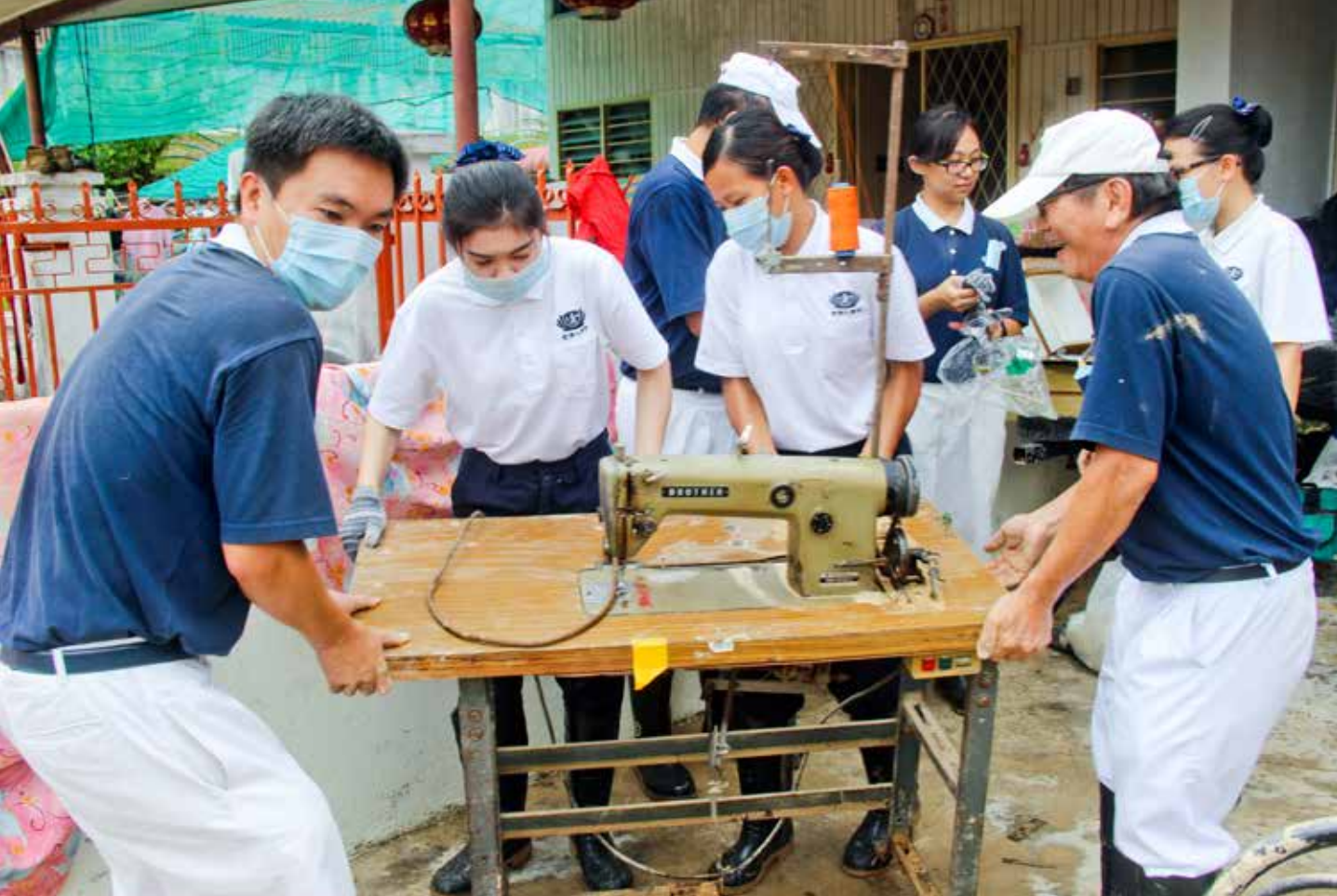
馬來西亞檳城等地的破紀錄豪雨釀成水災，慈濟志工與人醫會成員協助清掃。