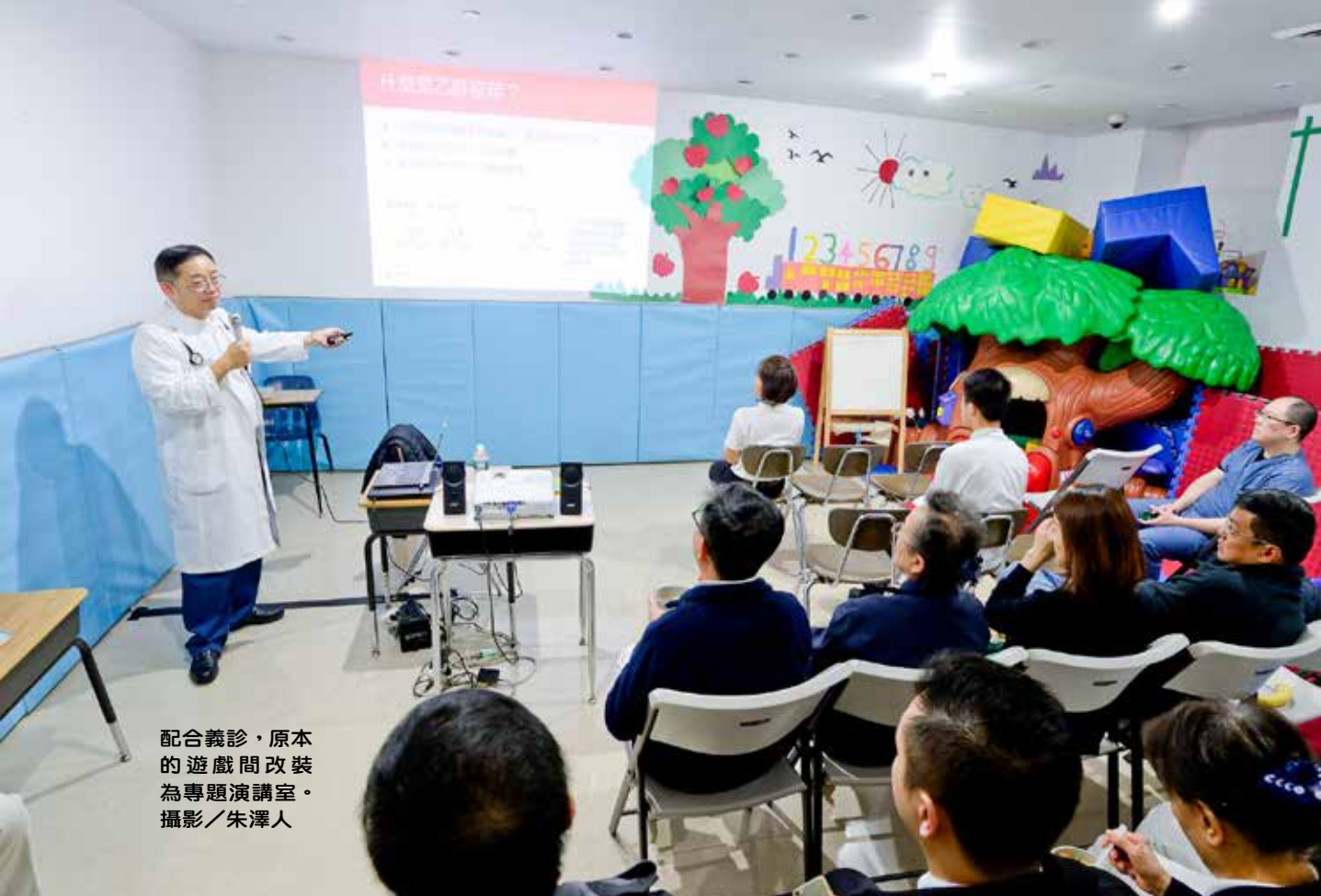
配合義診，原本的遊戲間改裝為專題演講室。