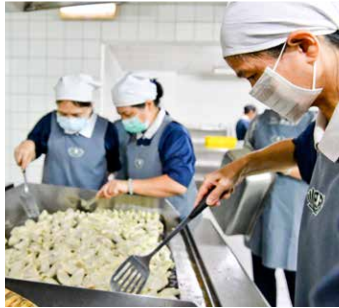
香積志工用心烹調，看顧與會貴賓與學員的胃。