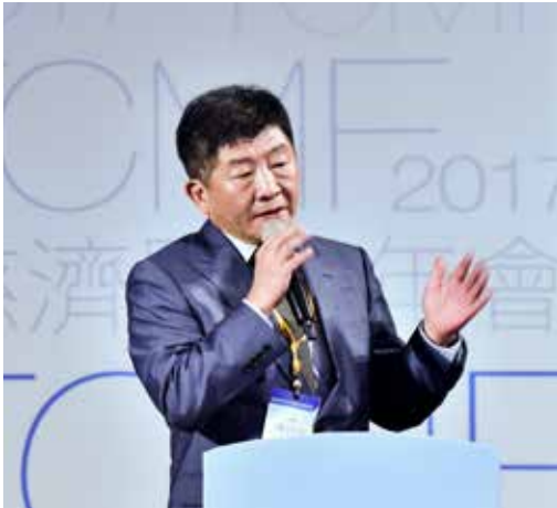
衛生福利部陳時中部長演講醫療政策未來的展望，他特別提到，如何讓醫療機構與長照體系有更密切的連結，以創造民眾最大效益是目前最需要努力的方向。