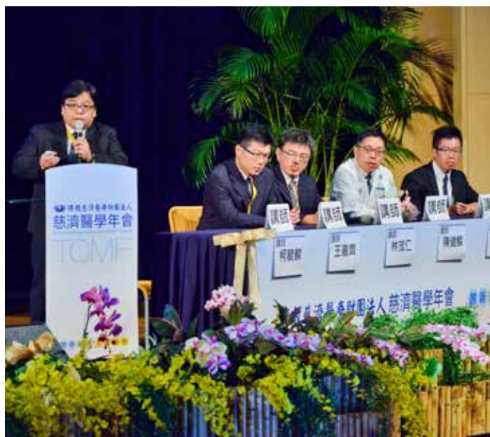
六院研究成果發表，兩小時內發表二十四篇論文。