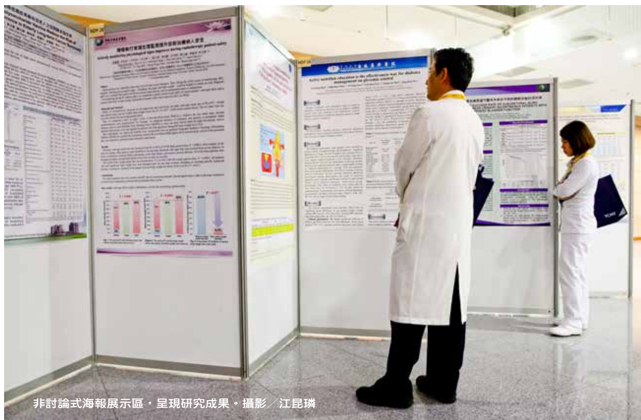
非討論式海報展示區，呈現研究成果。