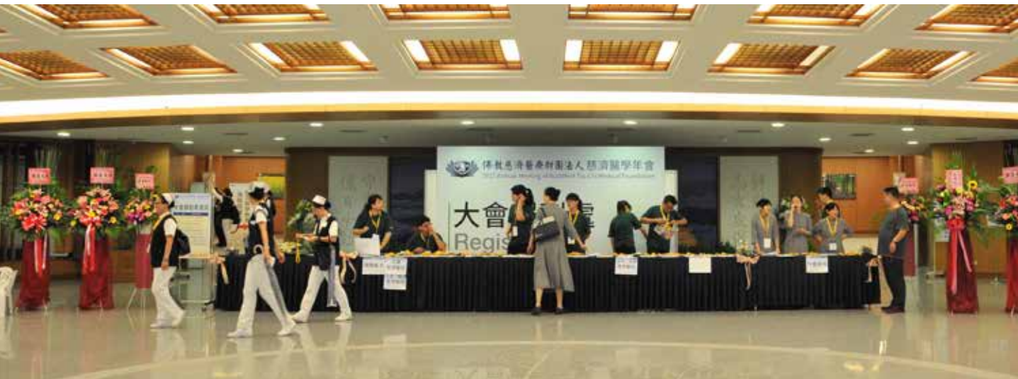
場地移師到慈濟大學，志工與年會工作團隊齊心合力，完成場布，為開幕式做準備。

慈濟醫療志業從義診免費施醫施藥開啟，迄今已走過四十五個年頭，慈濟醫療志業林俊龍執行長感謝大家冒雨前來參與盛會，他表示：「從花蓮慈濟醫院啟業這三十二年來，陸續在臺灣的北、中、南、東成立六家醫院服務鄉親，在醫療人文方面，相信大家有目共睹，然而在專業方面，尚缺一個平臺，讓各界深入了解慈濟醫療的研究與創新成果，今年副執行長郭漢崇發願籌辦第一屆慈濟醫學年會，是一個創舉，以後每一年慈濟會在各