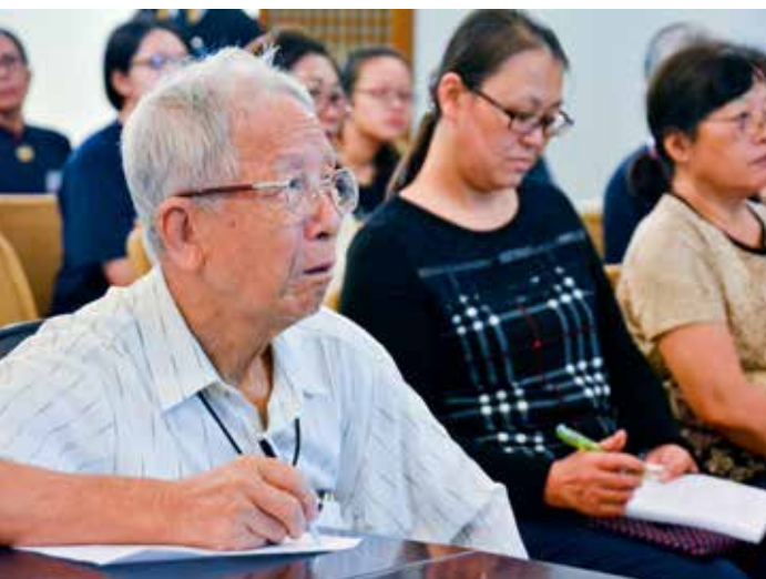
「民眾健康講座」吸引不少民眾一早入座。還有長者一早就搭計程車來，希望多了解牙周病的治療與保健，勤抄筆記，令人欽佩。