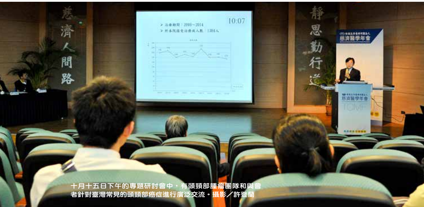
十月十五日下午的專題研討會中，有頭頸部腫瘤團隊和與會者針對臺灣常見的頭頸部癌症進行廣泛交流。