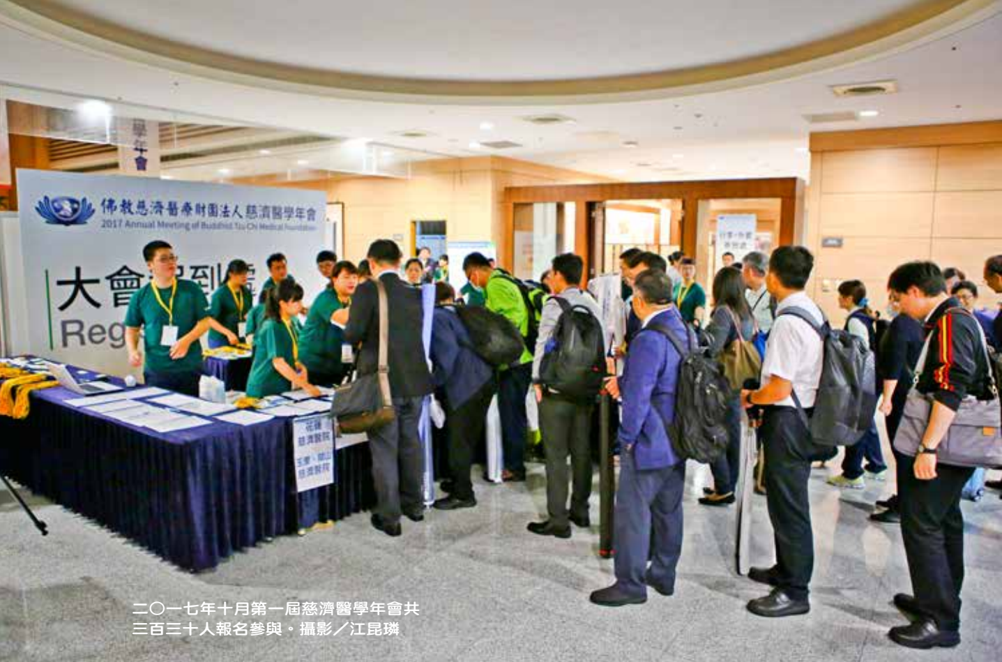
二〇一七年十月第一屆慈濟醫學年會共三百三十人報名參與。