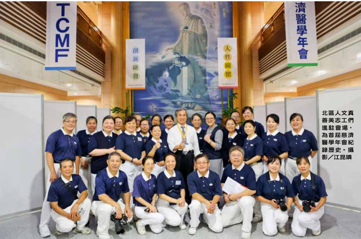
北區人文真善美志工們進駐會場，為首屆慈濟醫學年會紀錄歷史。