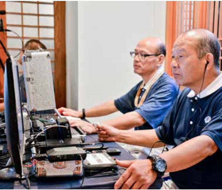
感恩北區人文真善美團隊協助課錄，影片整理後，陸續放上網站供民眾點閱。