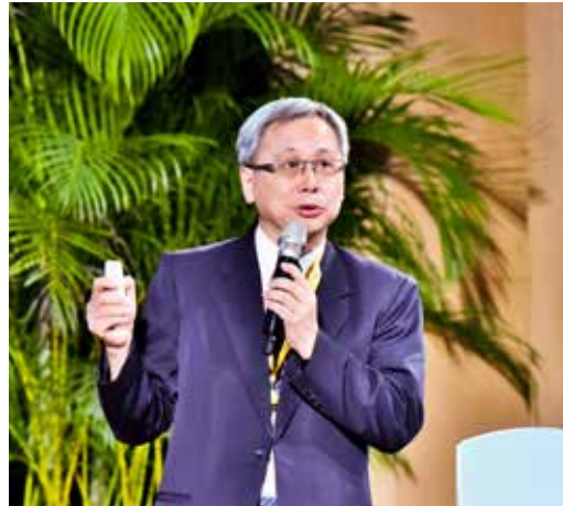
國民健康署王英偉署長以「健康城市、慈悲城市」為題，談如何打造高齡友善城市。