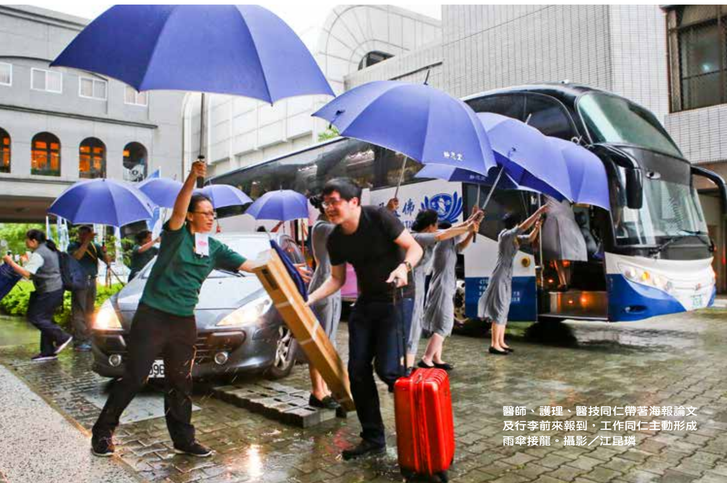
醫師、護理、醫技同仁帶著海報論文及行李前來報到，工作同仁主動形成雨傘接龍。