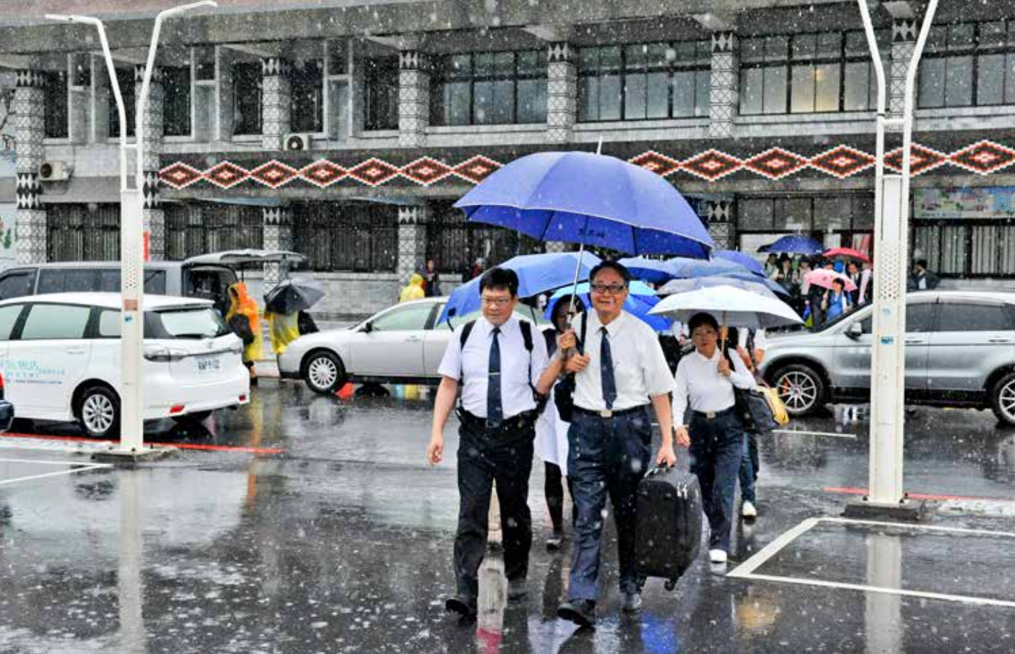
二〇一七年十月十四日中午，臺北、臺中、大林慈濟醫院同仁在雨中抵達花蓮，準備參加第一屆慈濟醫學年會。