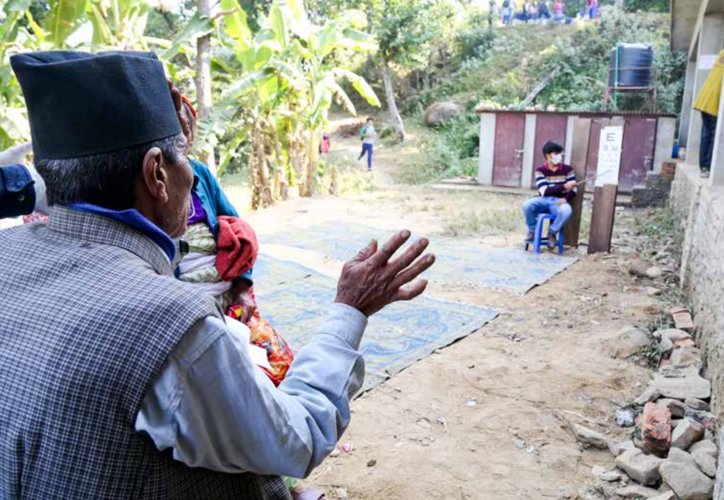
十二月八日首場義診，本土志工利用戶外進行眼科檢查。

紅腫、流淚，看不見東西。醫師進一步檢查後，發現她的狀況不理想，請她到醫院做進一步檢查。