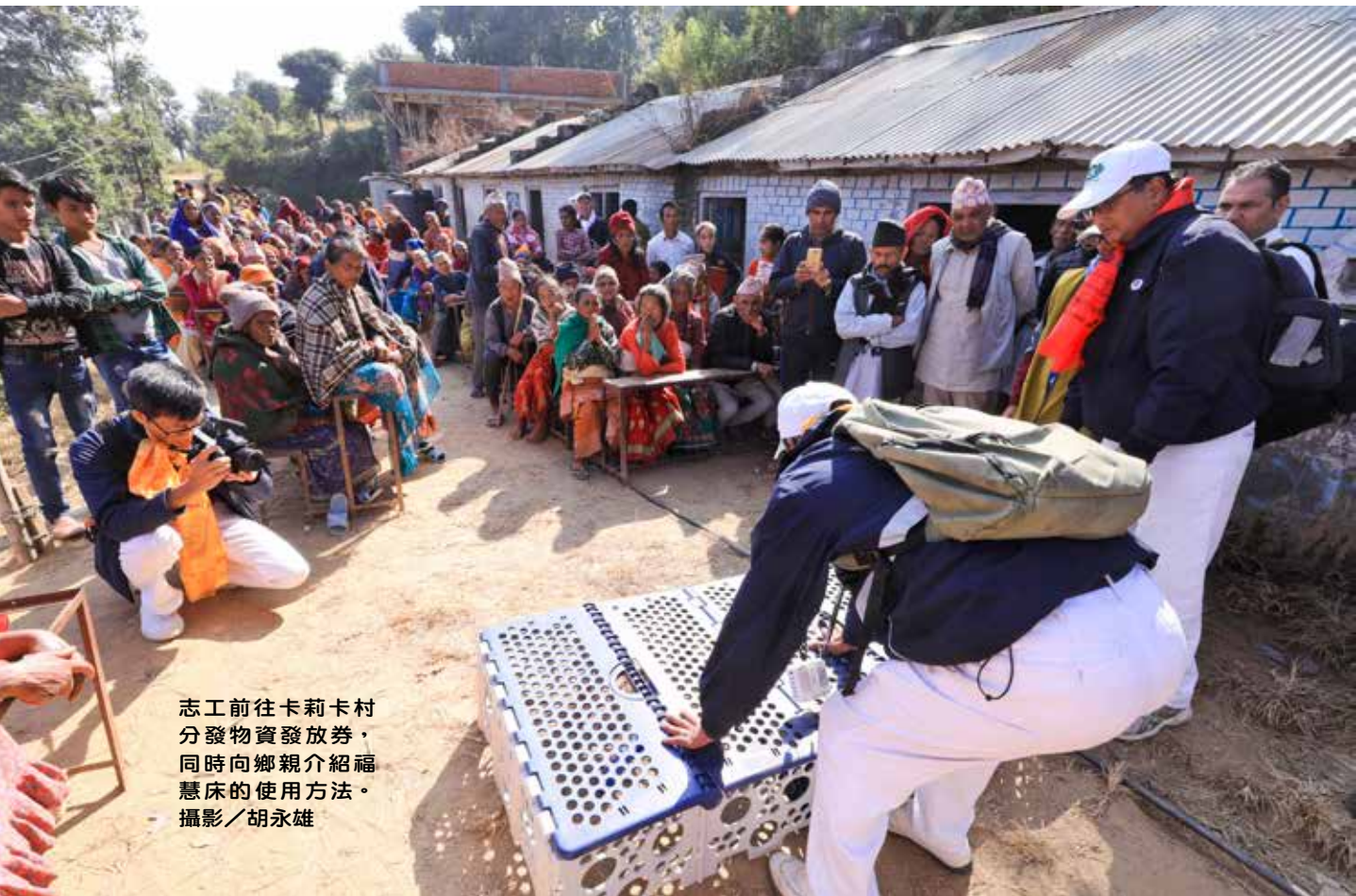
志工前往卡莉卡村 分發物資發放券， 同時向鄉親介紹福 慧床的使用方法。