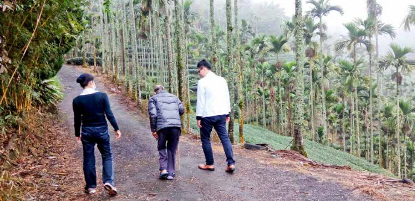
經針灸後的江阿公，行走漸順，沿往山下的小路，步伐愈發輕快，陳醫師和護理師貼心陪伴。