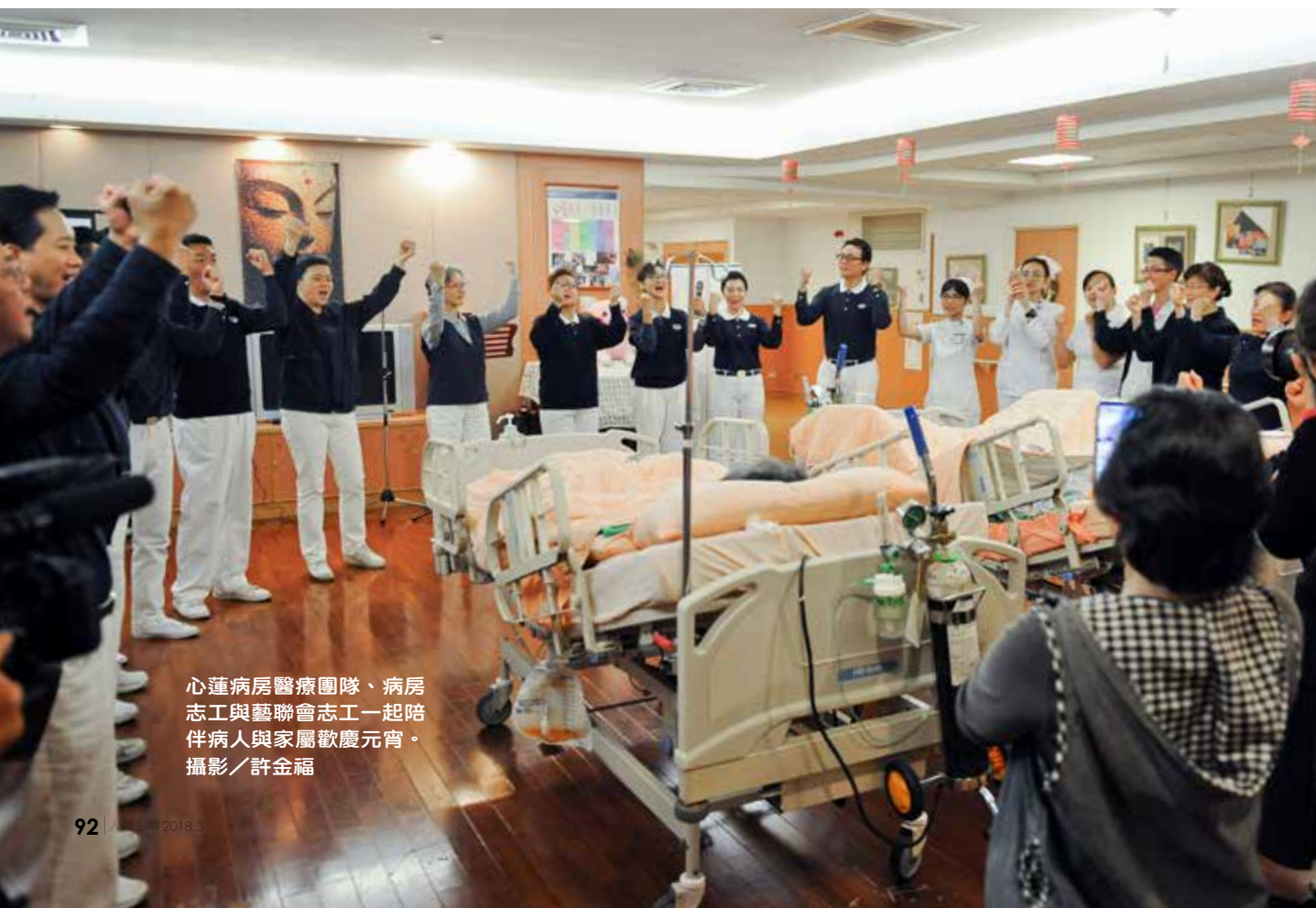
心蓮病房醫療團隊、病房 志工與藝聯會志工一起陪 伴病人與家屬歡慶元宵。

藝聯會志工溫馨表演一首首經典老歌〈甜蜜蜜〉、〈小城故事〉等，載歌載舞，歡樂氣氛充滿心蓮病房。病人們臉上掛著笑容，也跟著旋律舞動雙手。