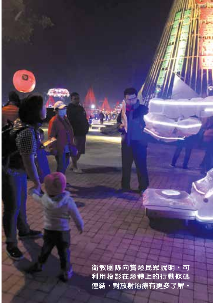
衛教團隊向賞燈民眾說明，可利用投影在燈體上的行動條碼連結，對放射治療有更多了解。