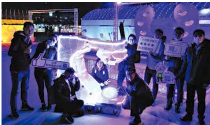
放射腫瘤科團隊親手打造直線加速器造型的環保花燈，在燈會上展示並向民眾衛教宣導。

努力地解說，可見民眾對健康知識的需求很大，這晚也成了大夥難得的生活體驗。蔡主任也感恩有洗腎室、工務室的協助，讓這次的花燈製作與推廣活動大成功。（文／張菊芬）