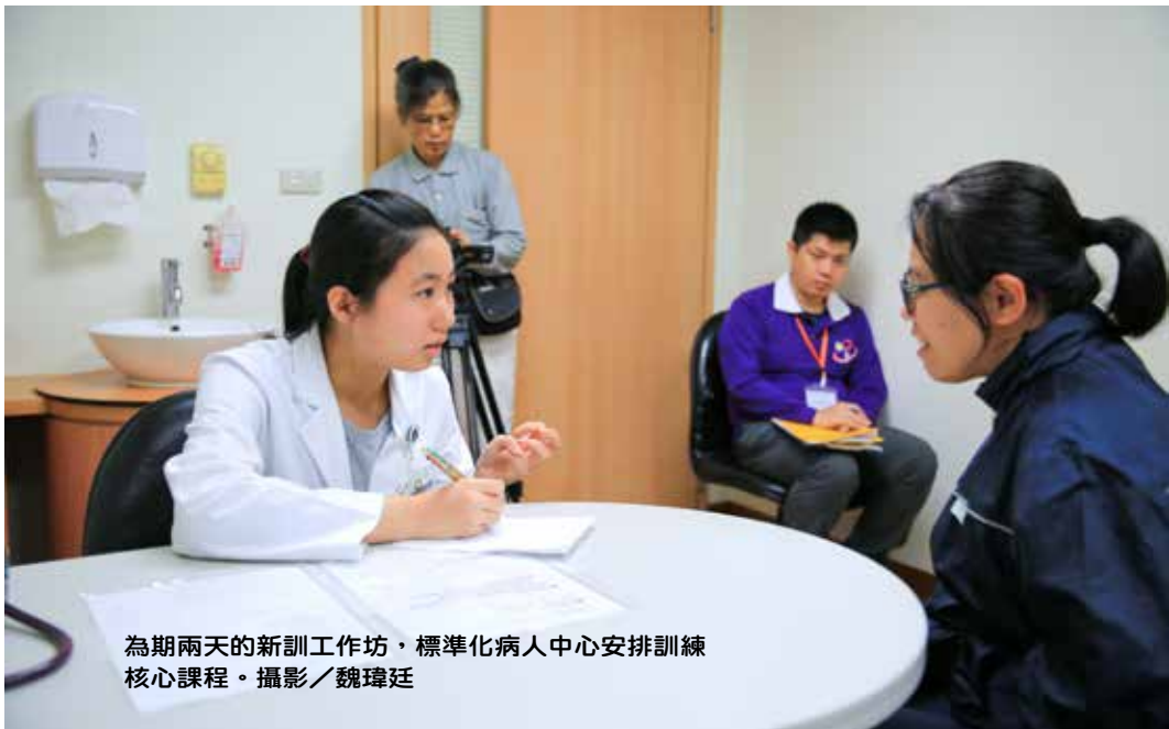
為期兩天的新訓工作坊，標準化病人中心安排訓練核心課程。

慈濟標準化病人中心更是全臺灣首創、甚至是全世界第一個完全由志工擔任標準化病人的機構，引領「以志工擔任標準化病人」的風潮！慈濟標準化病