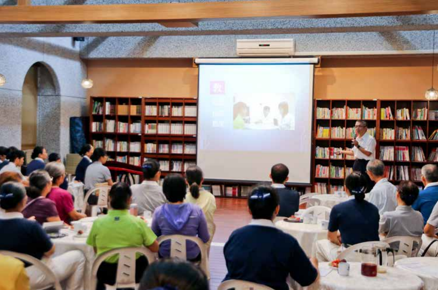
花蓮場標準化病人招募茶會。來自臺北、宜蘭、花蓮的慈濟志工踴躍參加，報名表單如雪片般地飛來。

沒有人願意患病，卻有一群健康的人，甘願冒著「沒病裝病」的忌諱，接受全然陌生的醫學教育訓練，來扮演病人，協助醫學生與新進醫療人員學習正確的醫療技巧，他們是——標準化病人（Standardized Patient）！