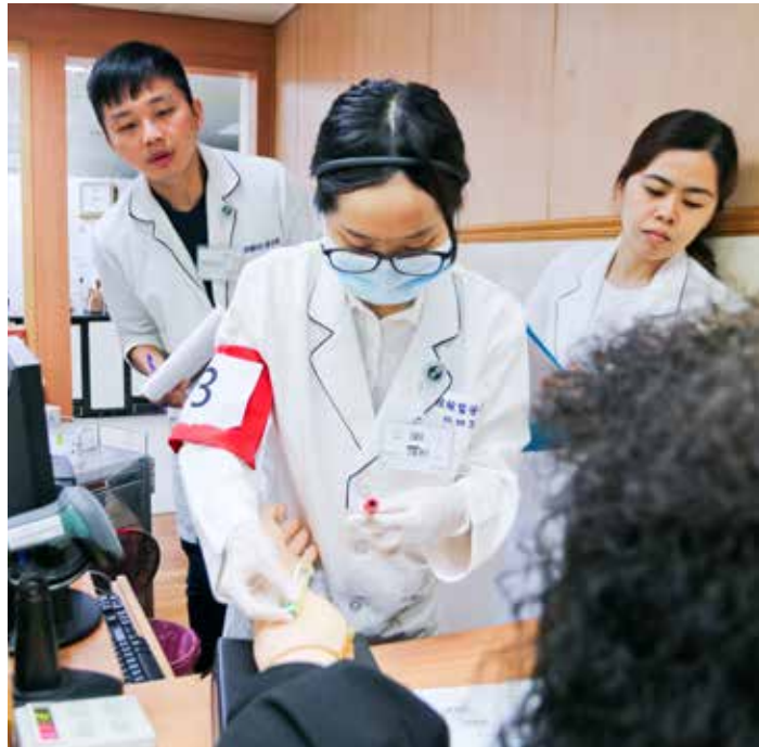
檢驗醫學科於二〇一七年加入標準化病人考試，未來，標準化病人中心將推廣至更多醫事職類科別。

高聖博醫師表示，由於新加坡的華人文化與臺灣文化背景相近，雙方在標準化病人教案撰寫、考官培訓、教師招募等議題所遭遇的難題相當雷同。然而，新加坡大學並無標準化病人訓練師的培