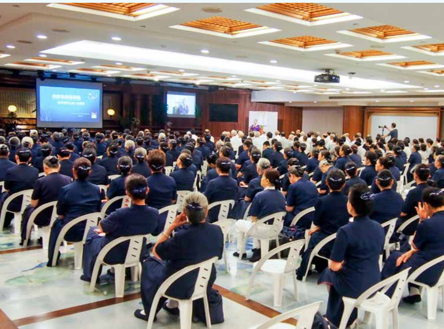
標準化病人中心團隊於慈濟志工精進日舉辦標準化病人招募講座。