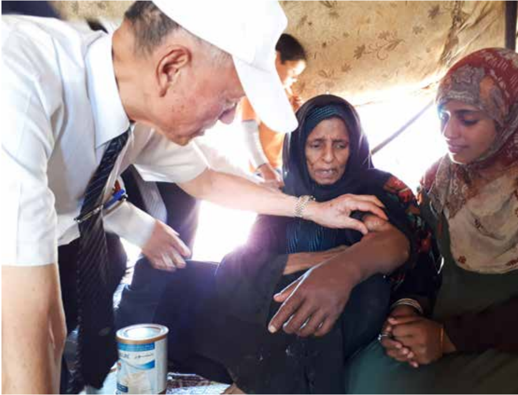
卡蜜麗女士的左手臂因洗腎長了一顆大瘤，她感謝慈濟六年不斷的關懷，圖為慈濟醫療志業林俊龍執行長等人前往問診，也請約旦分會評估後續醫療援助。

散居在窪地阿頓 (Wadi Abdoun) 及河谷區，因為政府的建設政策迫使他們三次遷移，到處流離，只是不管他們流落到哪裡，約旦的慈濟人總是有辦法找到他們，持續給予溫暖與援助，十七年來未曾間斷過，這裡的年輕人，幾乎每一個都曾是慈濟志工抱在懷裡的小嬰孩。