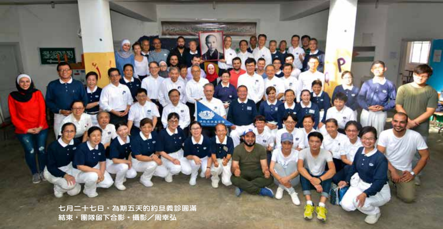
七月二十七日，為期五天的約旦義診圓滿結束，團隊留下合影。