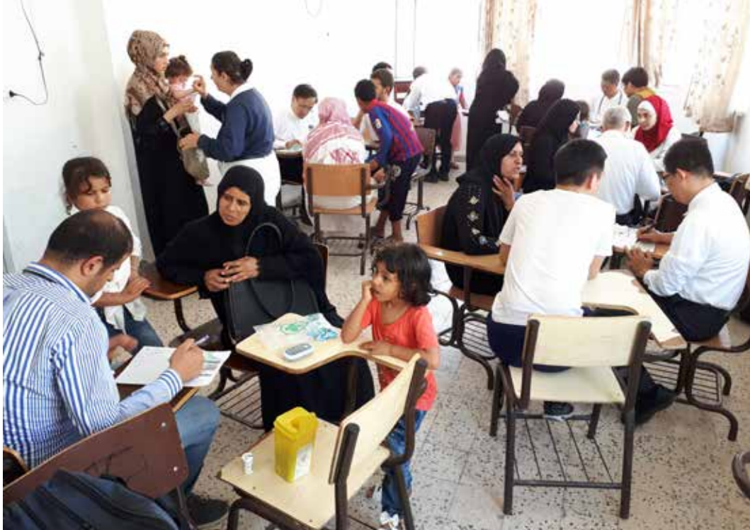
雖然在約旦的義診終有結束的一天，但對於敘利亞難民，除了提供醫療，也帶來希望。圖為七月二十七日義診一景。