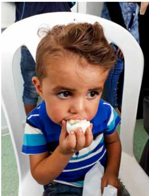
白煮蛋是當地旅館老闆延續二〇一六年約旦義診的愛心，捐送給敘利亞難民補充營養的，但志工發現仍有小小孩沒見過白煮蛋。

這一次義診，飯店老闆再度捐出五百顆白煮蛋，只是令人捨不得的是，依然有許多孩童不認識雞蛋，志工蹲下身子，教他們剝去蛋殼，髒髒的小手猶疑