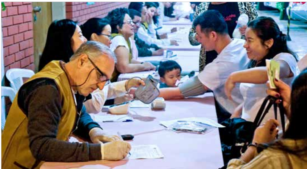
巴西聯絡處二十六周年慶，舉辦華人暨志工義診及醫學講座。圖為志工為民眾量血壓。