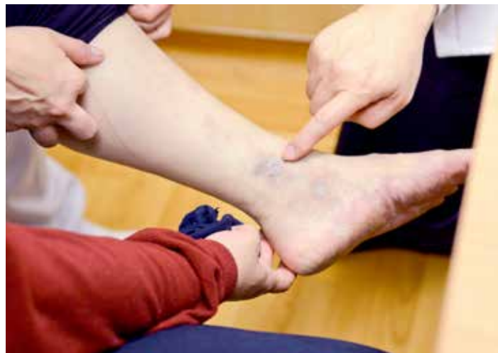
潰瘍的雙腳（左圖）在住院治療期間獲得控制（右圖）。