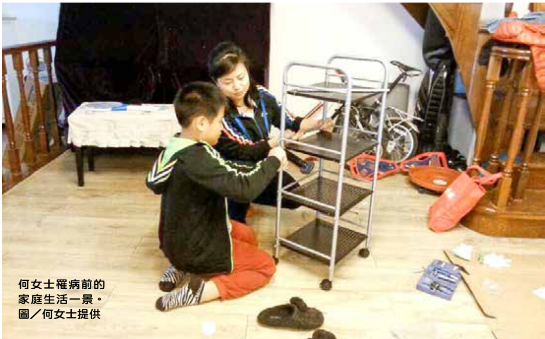
何女士罹病前的 家庭生活一景。

自此開展了數個年頭的求醫之路。為病所苦的何女士，奔走在南京和北京的各大醫院間，甚至來到臺灣，遍尋名醫，只為緩解身體的苦痛。怎奈各種藥物治療，始終未能有效對抗頑強疾病，走樓梯、坐公車上臺階，甚至用餐拿碗都困難，幾乎沒有生活品質。在何女士