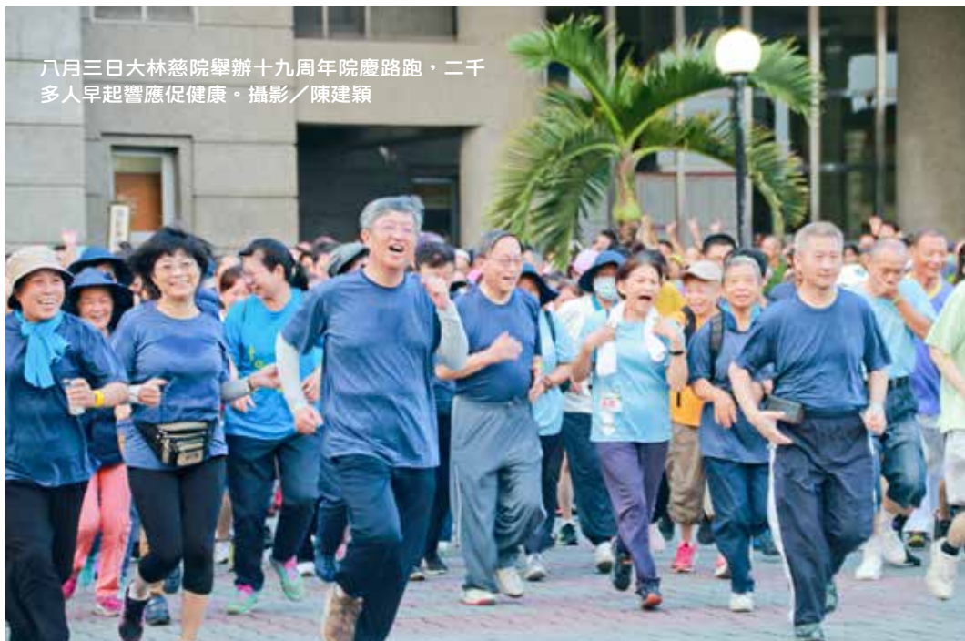
八月三日大林慈院舉辦十九周年院慶路跑，二千多人早起響應促健康。