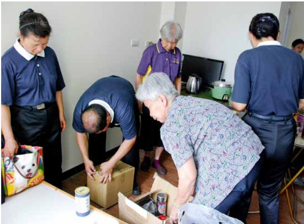
二〇一五年五月十四日，慈濟志工協助阿嬤住進安養中心，並幫忙搬運電視、冰箱、桌椅等生活用品，也布置阿嬤的新房間。

玉葉阿嬤獲選二〇一三年歲末祝福「人品典範」，公開分享她的故事，志工見證她由苦轉善令人感佩的一面，視她為「眾人的阿嬤」。簡素惠師姊跟阿嬤互動多年，認為這一個家庭最難能可貴的是他們從不覺得慈濟的付出理所當然，志工協助整理家中環境資源回收共獲五萬元，阿傑堅持捐出來。阿嬤在阿傑往生後，也馬上要求停發濟助金，希望把錢留給更需要的人。甚至得知敘利亞難民、發生國際重大災難時，阿嬤也捐出一萬元不等金額，寧可自己少吃、少用一點，也要讓需要的人「呷