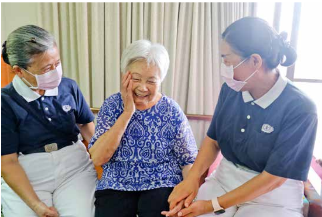
最近的廖劉玉葉阿嬤氣色看來好多了，臉上也常有笑容。慈濟志工陪伴已十年，還要繼續拉長情擴大愛。