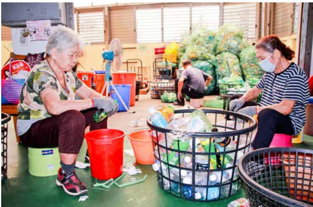
慈濟志工成了廖劉玉葉阿嬤的家人，記得兒子往生前的囑咐，阿嬤也把做志工當成日常的活動，活動活動，心裡的哀傷似乎就少了一些。