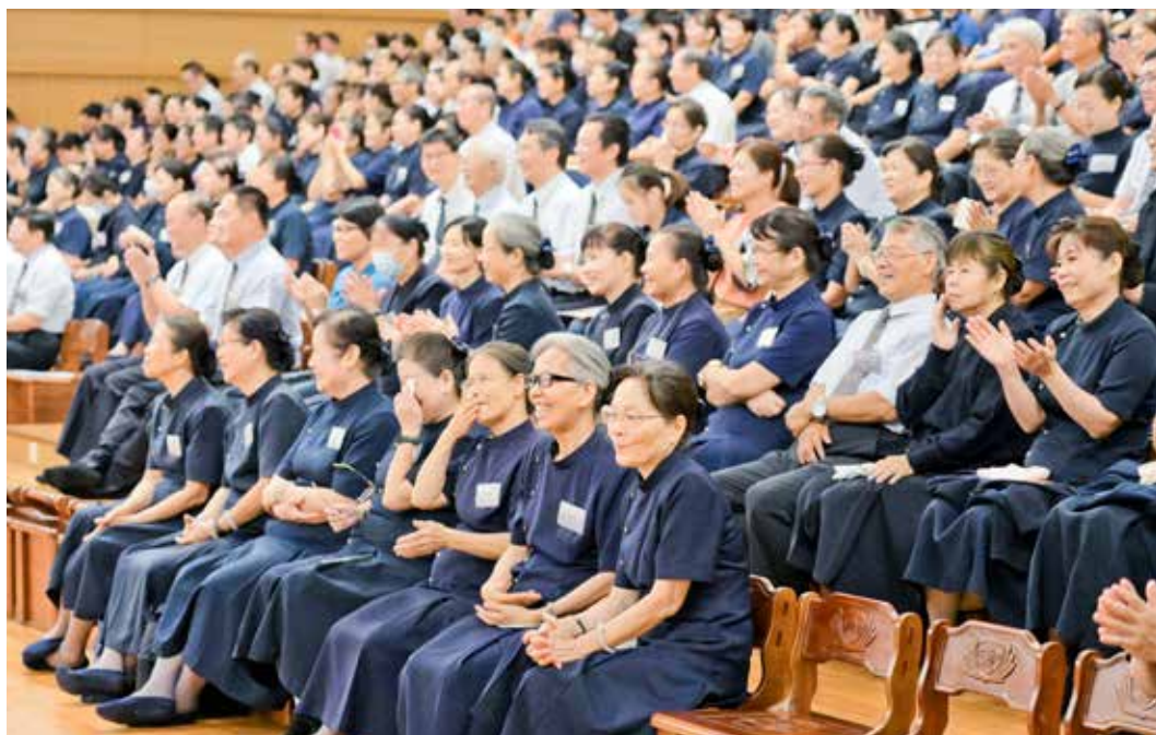
捐受者終能相見歡的場面，讓所有在背後付出的志工們流下開心的眼淚。