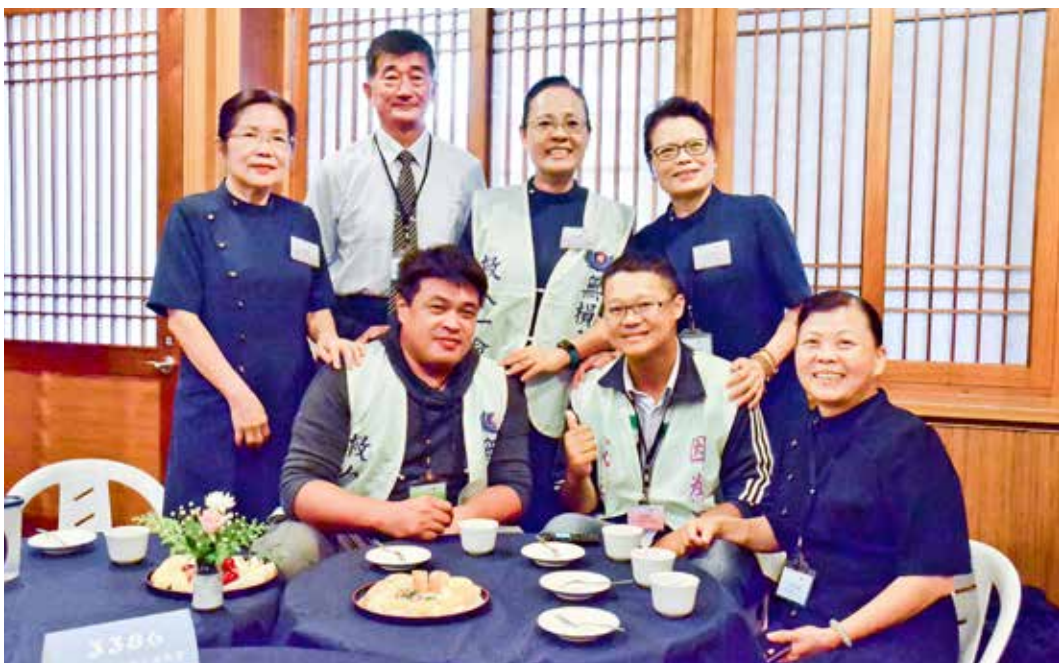
當時陪伴捐贈與院區關懷的志工也陪同他們一起相見歡，見證愛如影隨行之後，甜美的生命之果。