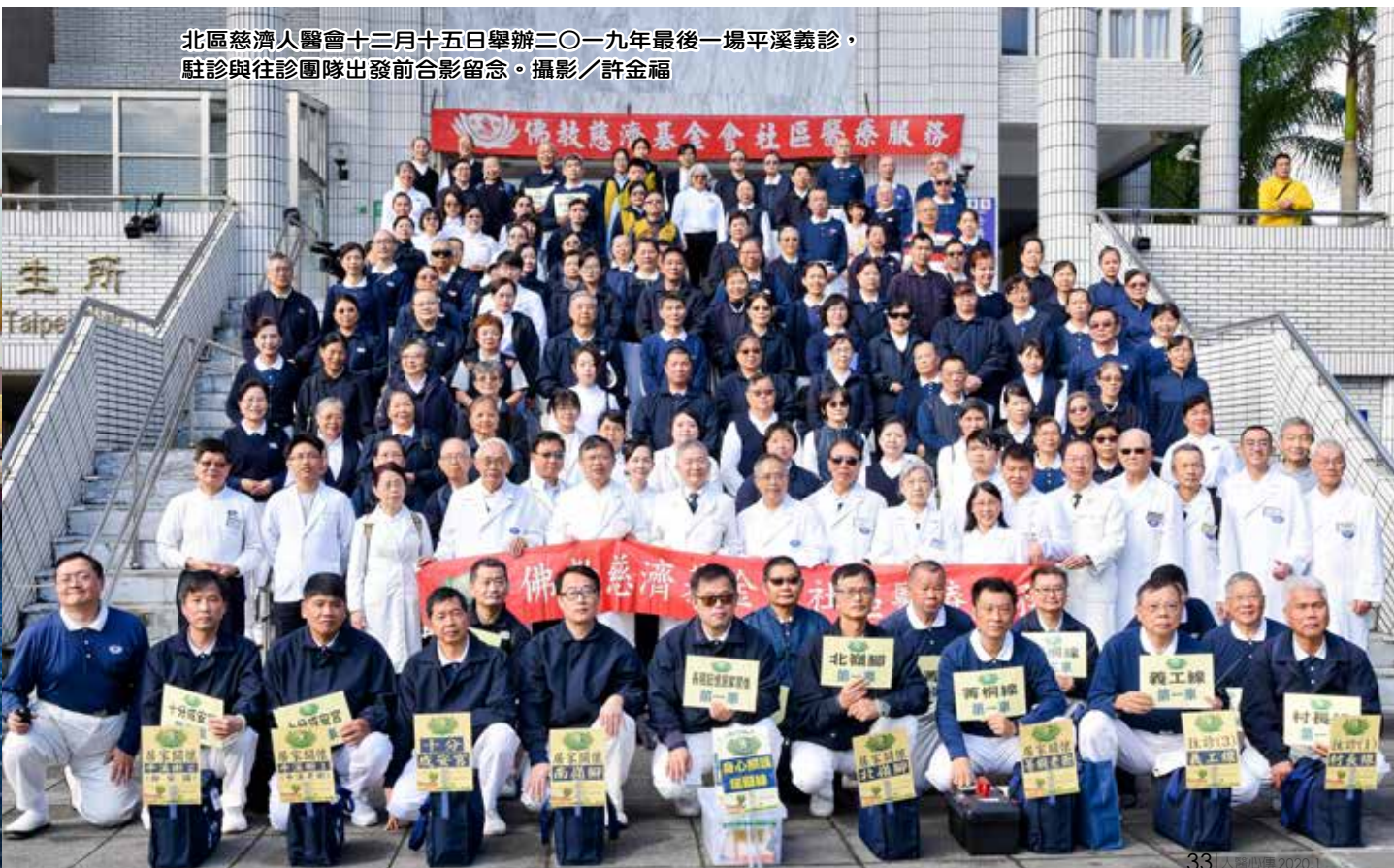
北區慈濟人醫會十二月十五日舉辦二〇一九年最後一場平溪義診，駐診與往診團隊出發前合影留念。