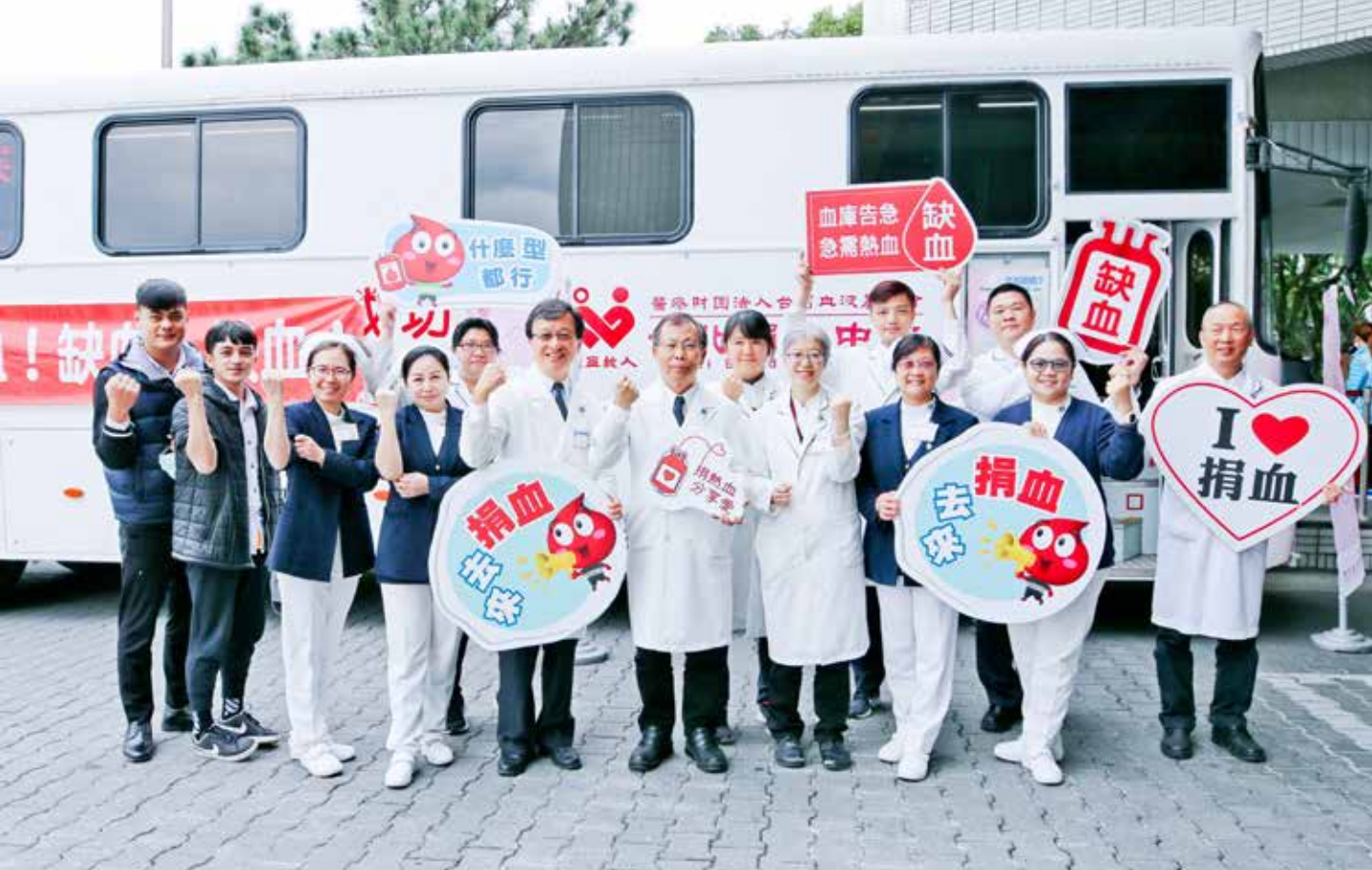
疫情燒鬧血荒，花蓮慈院與臺北捐血中心花蓮捐血站合作，二月十八日在大廳門前設捐血點，醫院同仁、志工與鄉親熱情響應。

表示，在開刀房的時候，看到這一袋血可以讓一個人獲救，是件很有價值又很快樂的事情，而且捐血可以促進血球再生及血液的新陳代謝，是維持健康的方法之一。