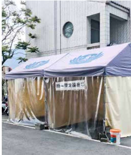
關山慈院二月重新搭建帳篷設立簡易發燒篩檢站。