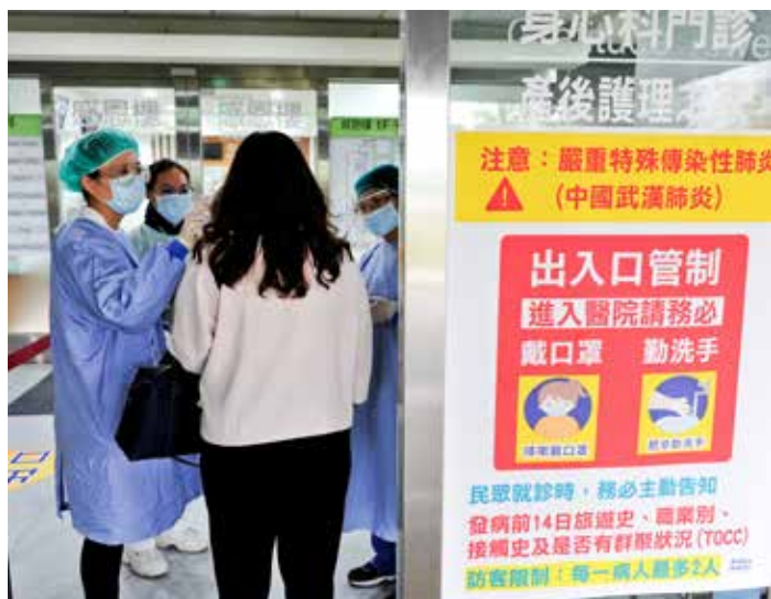
疫情資訊氾濫引恐慌，大林慈院呼籲民眾端正視聽，避免受假訊息影響。

新冠肺炎疫情不斷攀升，加上口罩供不應求，造成全球社會人心惶惶。大林慈院志工組為關心醫院全體員工，