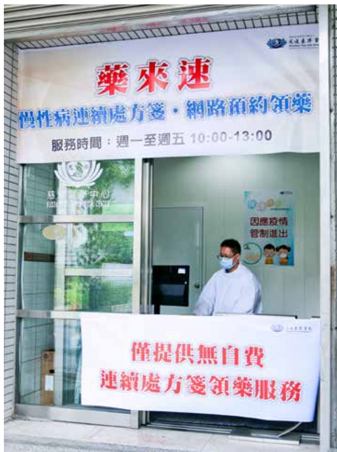
花蓮慈院側門啟用藥來速慢箋預約領藥窗口，提供慢性病連續處方箋網路預約領藥服務。

備，這時院內設置照護區域區隔政策就很重要，除了要固定照護人員以及固定照護區域外，病人分流也很重要，要規畫預備空間讓確診病患集中治療，讓醫療同仁限制工作範圍及不跨區域工作，減少院內感染風險。目前也已經規畫在急診增設「防疫門診」人力，由內科系醫師及家醫科醫師支援篩檢工作，隨時可配合中央疫情指揮中心超前部署政策。