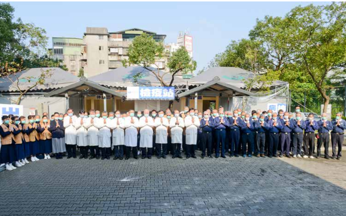
醫院與慈濟志工團隊通力合作，二月二十二日清晨，臺北慈院全新完工的「二十四小時戶外檢疫站」舉行啟用典禮。

出來，這是一個用愛打造的檢疫站，相信所有病患以及負責採檢、X光放射攝影的醫護菩薩，在這個檢疫站裡都可以平安不受感染，安然度過這場防疫的考驗！」