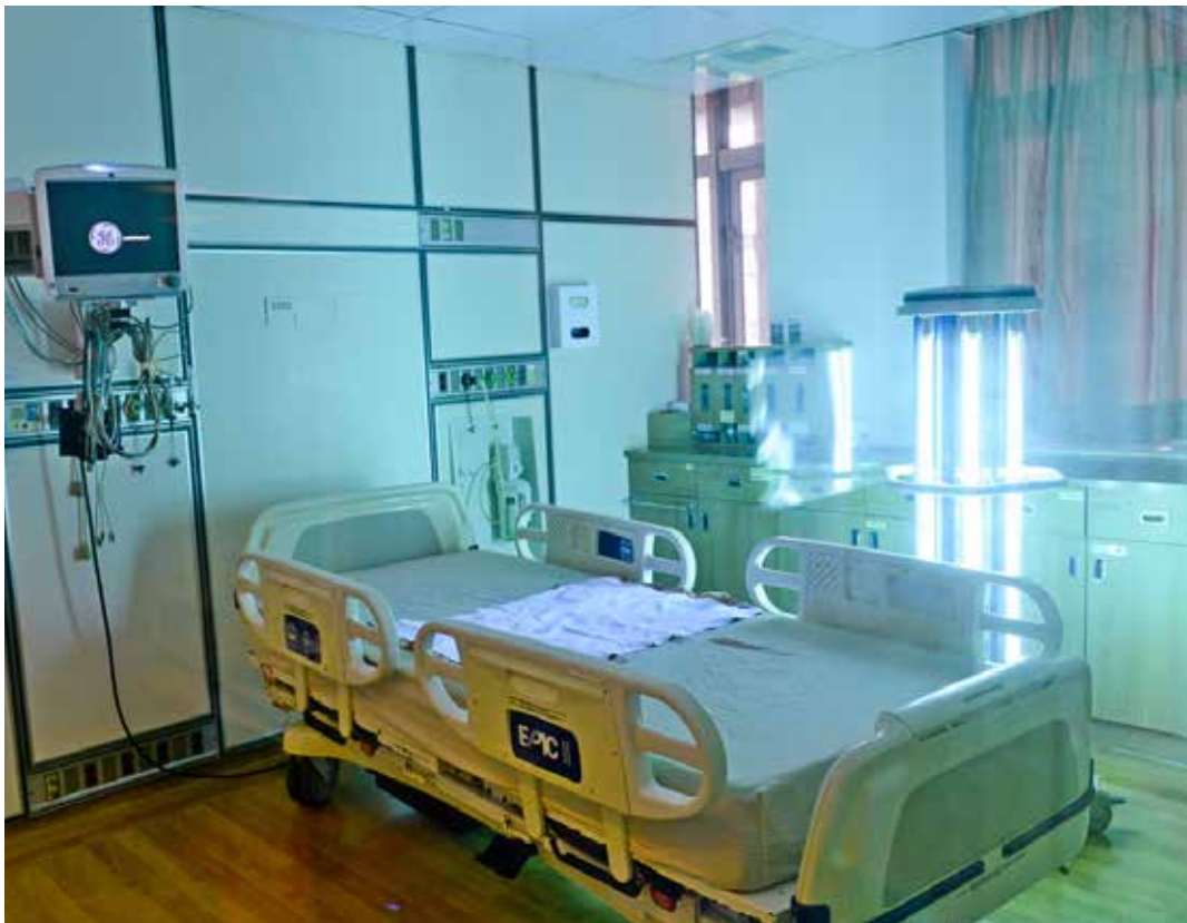
二月二十七日再引進「新型紫外線消毒機器人」，醫護可透過平板電腦設定清消時間，提升環境清消效益。

為了帶給醫護人員與病患更安全的照護環境，二月二十七日再引進「新型紫外線消毒機器人 (Hyper Light Disinfection Robot)」，改善傳統紫外線消毒燈需耗費的時間與殺菌程度，提升環境清消效益，保障醫護與病人安全。