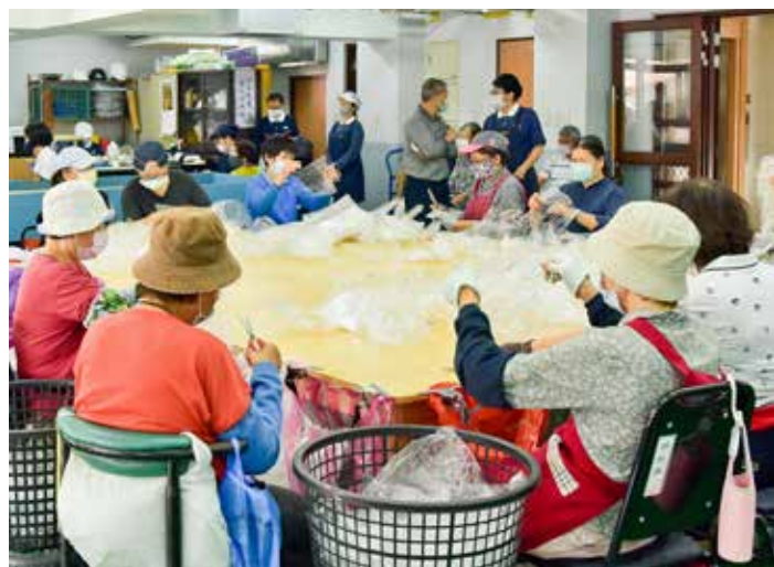
眾志工一邊做分類整理，一邊也輪流到後方由義診團隊調理健康。

要性。慈濟志工守護大地之母的同時，也守護自身的安全，在嚴格遵守防疫守則下持續行動實踐，更同心祈願早日消弭災疫。