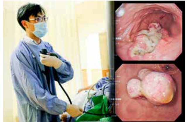
胃鏡檢查發現病人息肉，最大顆近三公分（右下）。